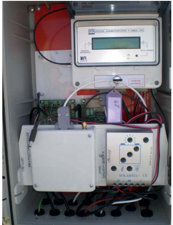
Imagen N°2: Gabinete principal (superior) donde se encuentran alojados el data logger con su display, las placas de los sensores, el módulo GPRS y el regulador de tensión

“El Rodeo” ubicado, como se menciona anteriormente, en la zona rural de Villa Ana.