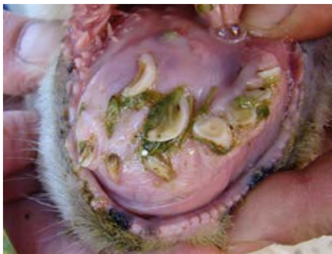
Figura 2: Nótese la distribución anormal de la dentadura en relación con la presencia de un quiste odontogénico