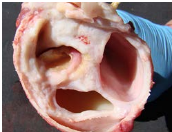
Figura 3: Quiste odontogénico con trabéculas interiores formando cavidades y restos de contenido líquido blanquecido en su interior