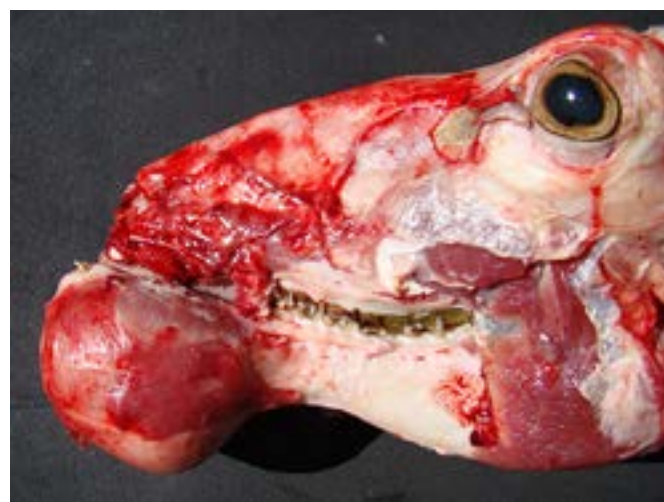
Figuras 1b: Aspecto y ubicación mandibular de un quiste odontogénico en uno de los animales afectados

Cuando se indagó sobre la presencia de la enfermedad en otros 11 establecimientos ovejeros de la zona, se determinó que sobre 2298 carneros sometidos a revisión clínica pre servicio, 29 tenían lesiones compatibles con las descritas, arrojando una prevalencia promedio de 1,3%, con un rango de 0,6% a 2,9%, viéndose afectados animales de diferentes edades, desde carneritos de 12-18 meses, hasta carneros de 2, 3, 4 y más años de vida.