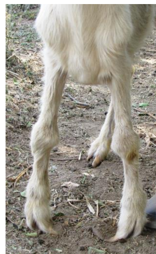
Figura 1. Artritis bilateral severa de los carpos en una cabrilla. Se observa deformación de ambos miembros.

En los casos que se logró realizar una necropsia, todos mostraron artritis que en sus inicios era de tipo serosa para después convertirse en proliferativa. En los más severos además se apreciaba necrosis caseosa (Figura 3). En animales de más larga evolución se observó erosión y adelgazamiento del cartílago articular que en algunos casos dejaba expuesto el hueso sub-condral (animal 2 y 5). En pulmón las lesiones fueron leves (animales 1, 4 y 5) y sólo en un animal se observaron lesiones macroscópicas (animal 4) caracterizadas por consolidación de los márgenes pulmonares. Los demás tejidos no presentaron lesiones macroscópicas de relevancia.