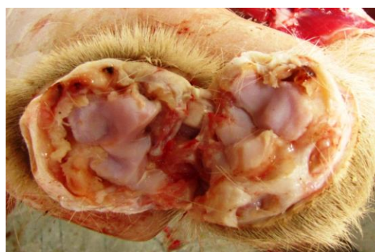
Figura 3. Lesión Macroscópica. Se observan lesiones proliferativas de la capsula articular que denota la cronicidad del cuadro.

Un resumen de los aspectos microscópicos de relevancia se presenta en las Tablas 3 y 4. Microscópicamente las lesiones articulares se caracterizaron por la infiltración linfoidea, acompañada de proliferación papilar de capsula sinovial y fibroplasia del tejido conectivo sub-capsular (animal 1). En algunos casos