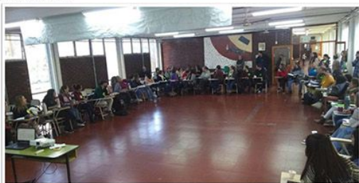
Figura 1: "Encuentro extensionista"

La propuesta se gestionó a partir de un "Encuentro extensionista" (Figura 1) organizado desde la Secretaría de Extensión Universitaria-SEU- y se enmarca dentro de la Extensión Crítica y la Educación Popular, fomentando el intercambio de saberes y la construcción colectiva, vinculando de forma crítica el saber académico y el saber popular.