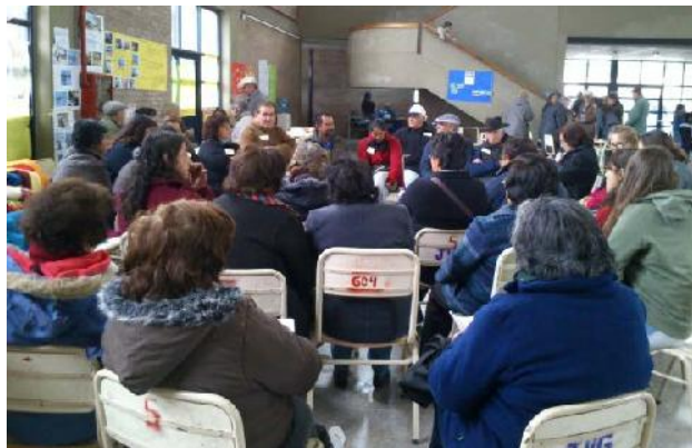
Foto 3: Trabajo grupal sobre las relaciones establecidas entre organizaciones e instituciones locales

El tercer encuentro se llevó a cabo en Chepes y buscó de alguna manera analizar las relaciones establecidas por las organizaciones con otros actores del medio. Esto persiguió construir una visión entre las agrupaciones: “Uniendo Voces para Ser Escuchados”.