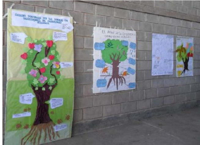
Foto 2: Árboles que representan logros, dificultades y trayectoria de algunas de las organizaciones participantes del 2º encuentro.

El tercer encuentro se llevó a cabo en Chepes y buscó de alguna manera analizar las relaciones establecidas por las organizaciones con otros actores del medio. Esto persiguió construir una visión entre las agrupaciones: “Uniendo Voces para Ser Escuchados”.