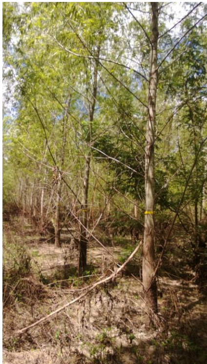
Figura 3: clon Ibicuy: fuste grado 4