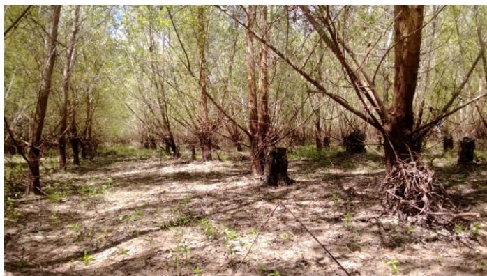
Figura 1: Vista general del ensayo, febrero de 2014

Al cuarto año (figura 1) se evaluó supervivencia, altura total (Ht), diámetro a 1,30 m (DAP) y forma del fuste. Para determinar la existencia de diferencias significativas se realizó un análisis de varianza. Al resultar significativos los valores de F, en el ANOVA, se efectuó la comparación de medias mediante el Test de Tukey ( p \leq 0,05 ). Sobre la base de la Ht y el DAP, para contar con una primera estimación integrando ambas variables, se calculó el incremento anual en volumen total con corteza (IMA; m^3 \cdot ha^{-1} \cdot año^{-1} ), aplicando un coeficiente mórfico de 0,55. El procesamiento de los datos se realizó aplicando el programa de análisis estadístico InfoStat Versión 2013 (Di Rienzo et al. , 2013). Para la valoración de la forma de fuste de los materiales, se aplicó una escala visual ordinal de seis grados, donde: Grado 0= fustes tortuosos y muy ramificados, hasta: Grado 5= fustes rectos, únicos, ramas escasas y alta dominancia apical (Cerrillo, 2006). Se consideró el grado más frecuente para cada clon.