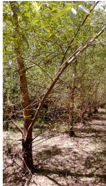
Figura 4: clon C-13-21: fuste grado 2/3