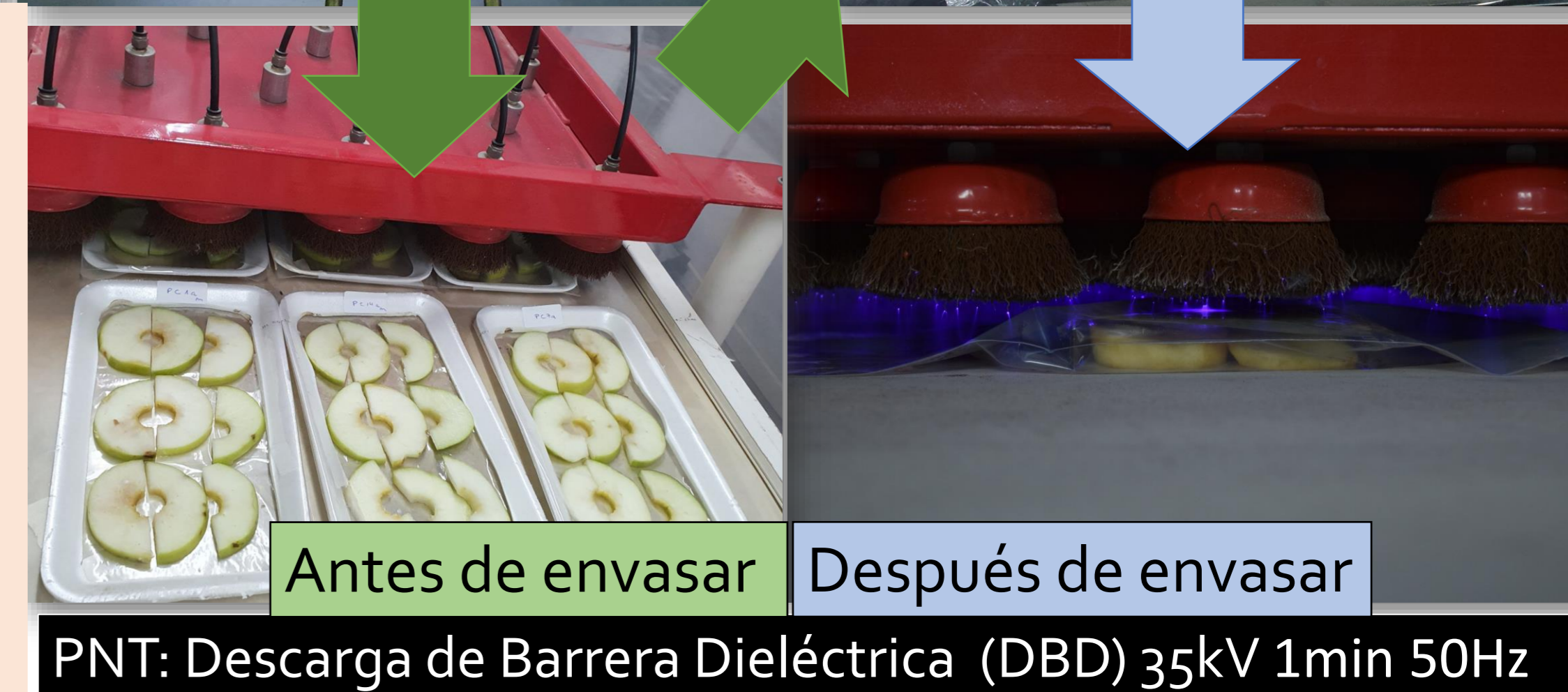
PNT: Descarga de Barrera Dieléctrica (DBD) 35kV 1min 50Hz

Estas observaciones se realizaron en muestras de tejido obtenidas en la superficie y en la zona interna de las rodajas.