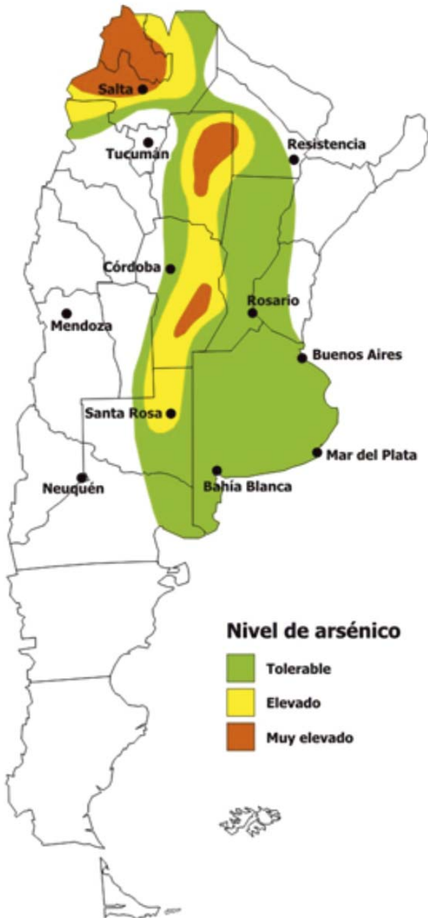
Presencia de arsénico en las distintas provincias argentinas.