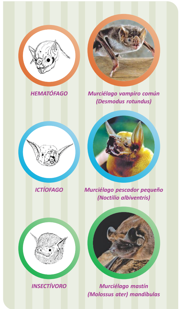
Diferencias físicas entre los vampiros.