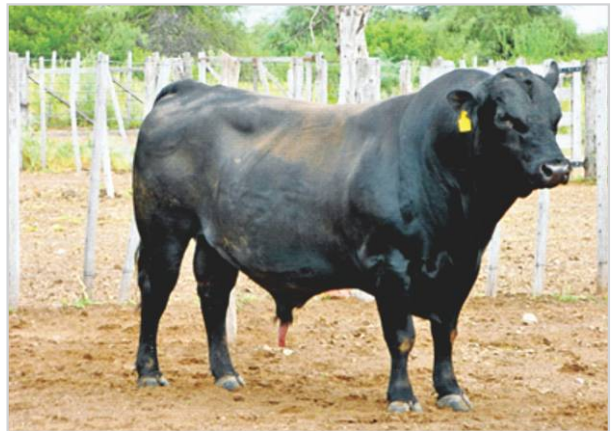
Toro listo para el servicio.

Realizar un muy buen manejo del rodeo es indispensable para alcanzar los objetivos de una producción eficiente y sustentable en el tiempo. Una garantía que permite tomar las mejores decisiones en el territorio. ☑