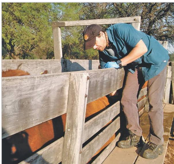
Vacunación del rodeo bovino.

En el caso de la Rabia Paresiente se vacuna por primera vez a todos los mamíferos que se encuentran dentro del establecimiento ganadero (vacas, caballos, cerdos, mulares, perros, gatos). Esto implica: si es una primovacuna requerirá de dos dosis con un intervalo de 21 días. Luego, para mantener el status sanitario se repite una vez al año la vacunación a todos los mamíferos.