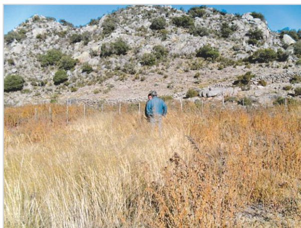
Recorrida y seguimiento de pastizales durante el invierno.