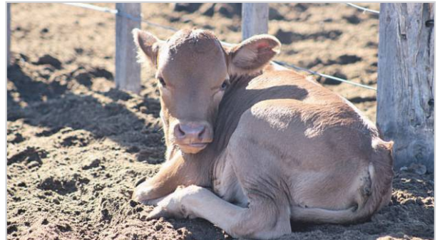
Ternero recién nacido.