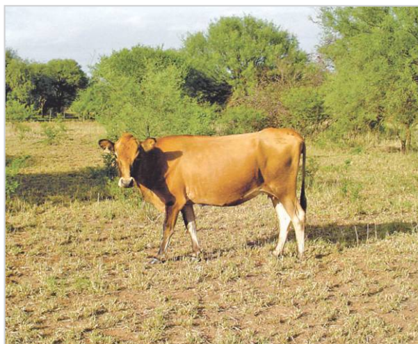
Vaca condición corporal 3,5 (escala 1 al 5).