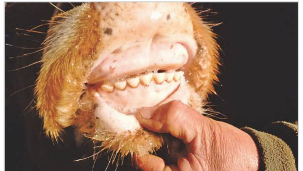
Dentición típica de una vaca CUT.