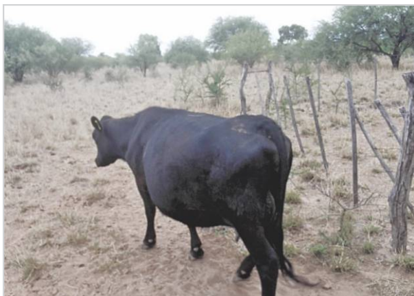
Apartado en potreros separados de vacas próximas a parir.