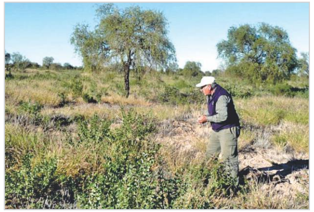
Control de pasturas.