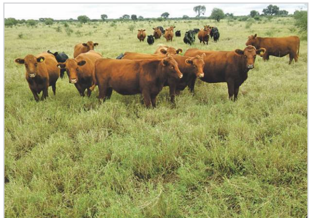
Vacas en condición corporal mayor a 3 listas para iniciar el servicio.