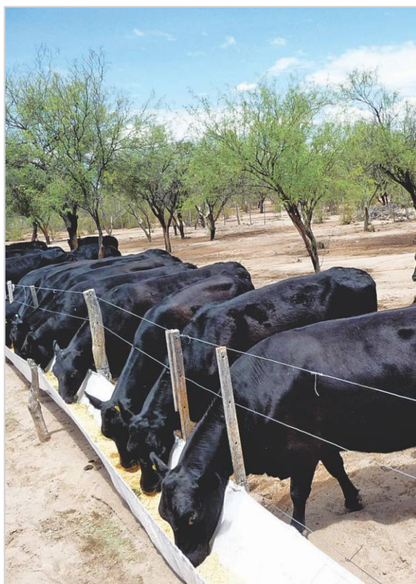
Suplementación estratégica de vacas en momentos críticos.