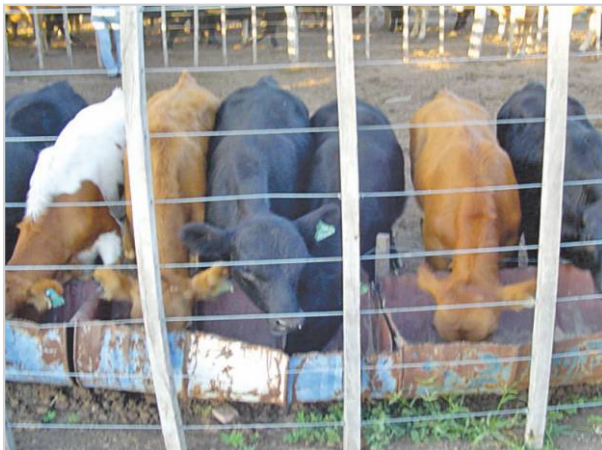
Seguimiento del acostumbramiento de terneros.