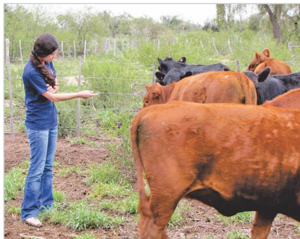
Selección de terneras y vaquillonas de reposición.

Vaya viendo el estado de la ternera, seleccione aquellas ternero/as que formaran parte del plantel. Es recomendable siempre seleccionar ternero/as "cabeza de parición" es decir, los primeros en nacer. Se recomienda un porcentaje de reposición anual del 20%. ☑