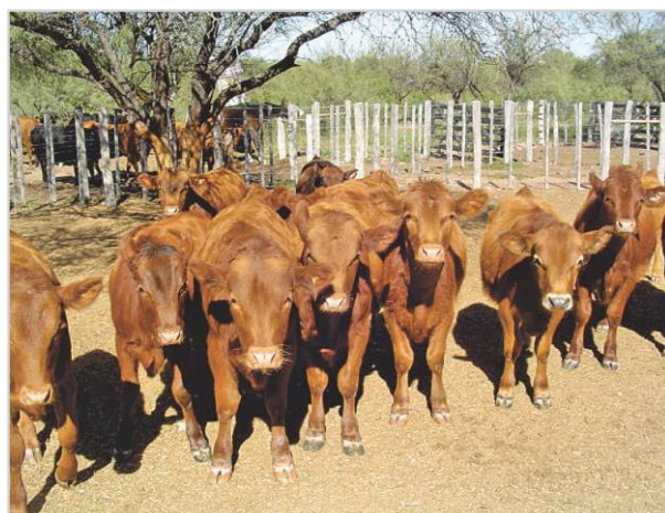
Lote de terneras de reposición.