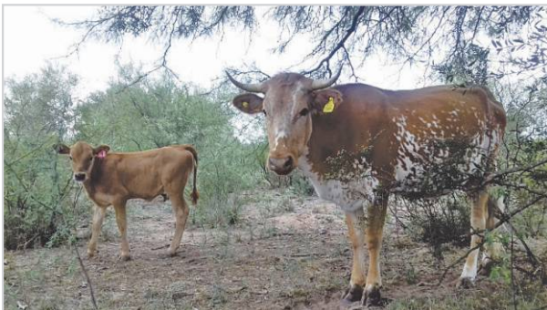
Vaca con cria al pie.