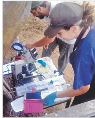
Preparación de pajuelas para IATF.

Es clave elegir el toro correcto porque estos deben estar alineados a nuestro objetivo de producción. Elegir el toro incorrecto nos puede traer muchos problemas (distocias, aumento del tamaño corporal del rodeo, menor mansedumbre, menos adaptabilidad, etc.).