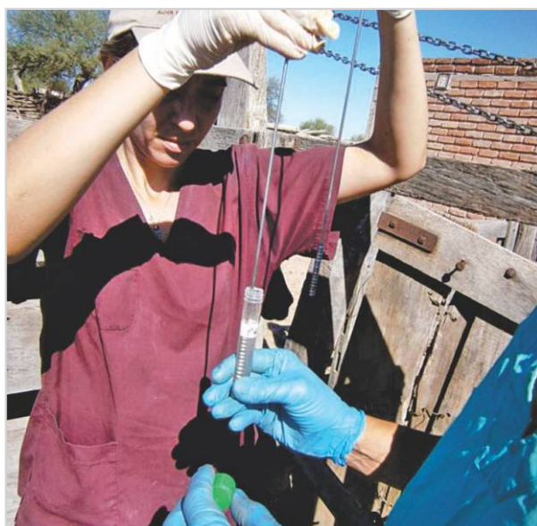
Raspajes prepuciales en toros.