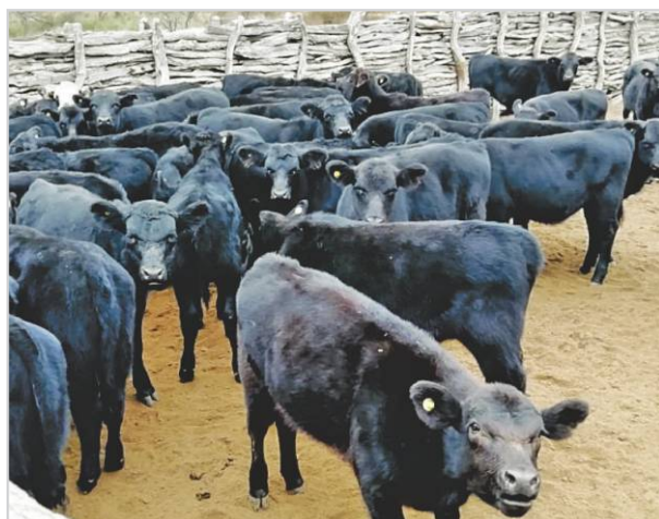
Lote de terneros destetados.