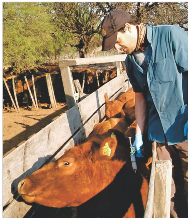
Vacunación a vacas.

Las vacunas se realizan contra enfermedades respiratorias (IBR, BSRV, PI-3, DVB, Pasteurellas y Histophilus Somni) y contra enfermedades del complejo diarreico tales como Rotavirus, Coronavirus, Salmonella, Escherichia Coli y Clostridium Perfringens. Con esta práctica se inmuniza a través del calostro a los terneros por nacer. ☑