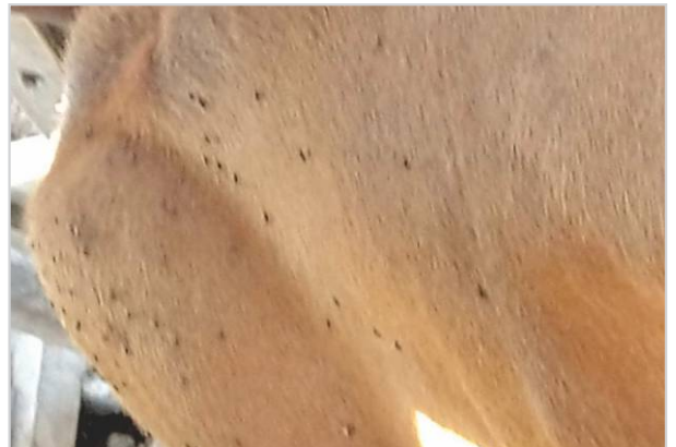
Control de parásitos externos.