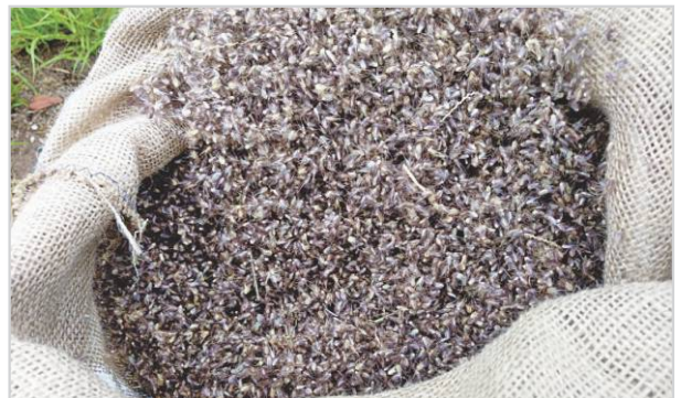
Semilla de Bufell Grass.

Las pasturas megatérmicas como el Buffel grass, son un recurso forrajero muy importante para nuestra región. A partir de octubre aumentan las temperaturas y se reanudan las lluvias, pudiéndose extender la siembra de esta pastura hasta febrero inclusive, dependiendo de las lluvias. ☑