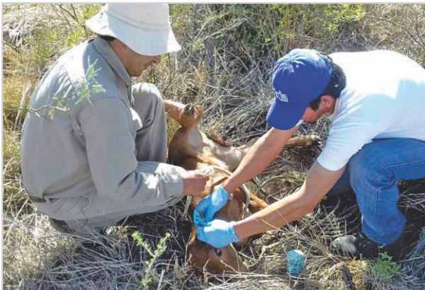
Control de miasis en terneros.

Cuando destetamos los terneros se estresan, por eso debe garantizar corrales con sombra y agua disponible para disminuir el estrés, además debemos vacunar para evitar enfermedades, principalmente del aparato respiratorio y digestivo. ☑