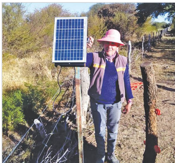
Revisión de boyero eléctrico.