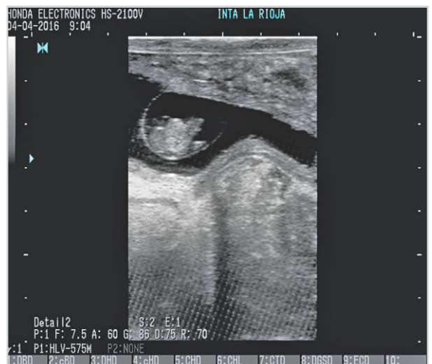
Diagnóstico de preñez temprana por ecografía.