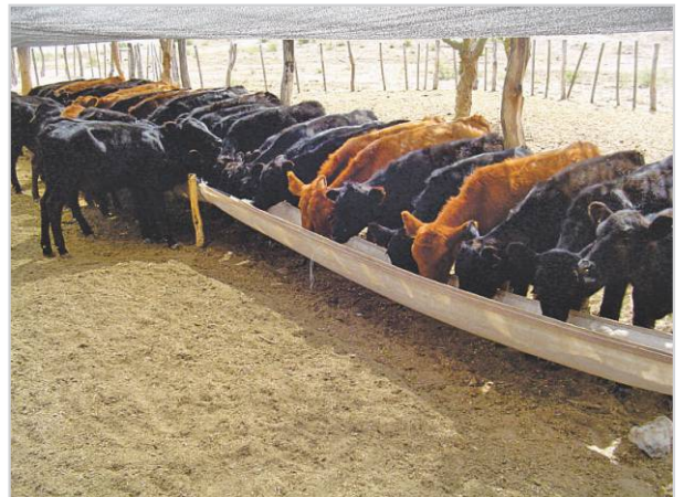
Control diario del estado de los terneros.