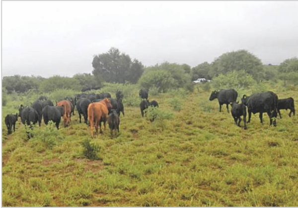
Momento de cambiar potreros.