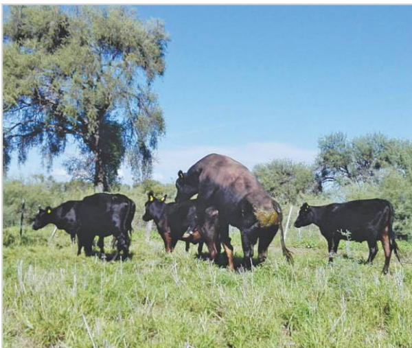
Servicio del rodeo de cría.

En el momento previo al inicio del servicio ¡ Acordarse de separar las vacas CUTs ! ¿ Qué es una vaca CUT ?, ya lo verá en mayo o junio.