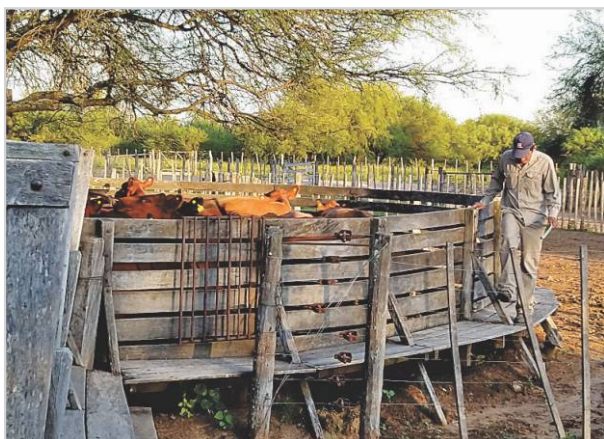
Recorrida de instalaciones.

Durante el invierno es importante recorrer los potreros y conocer la disponibilidad de forraje, para ver cómo llegamos hasta que se reanuden las lluvias.