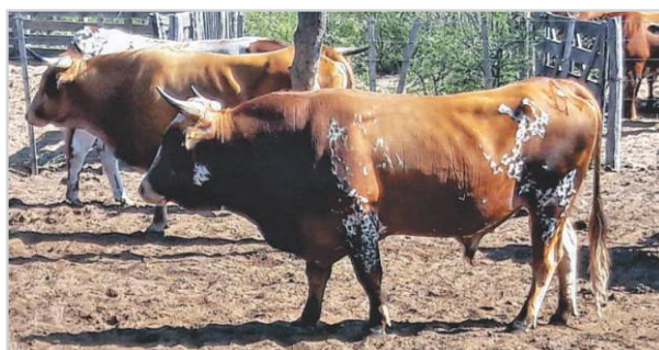
Revisión exterior del aparato reproductor (pene y testículos), vea sus aplomos (patas y manos), ojos y dientes.