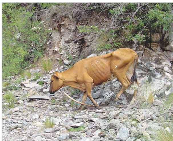
Vaca condición corporal 2.