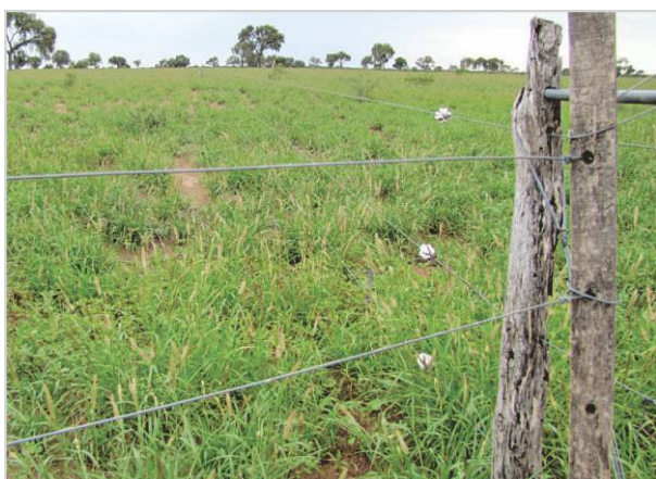
Control de boyeros, mantenimiento y limpieza.