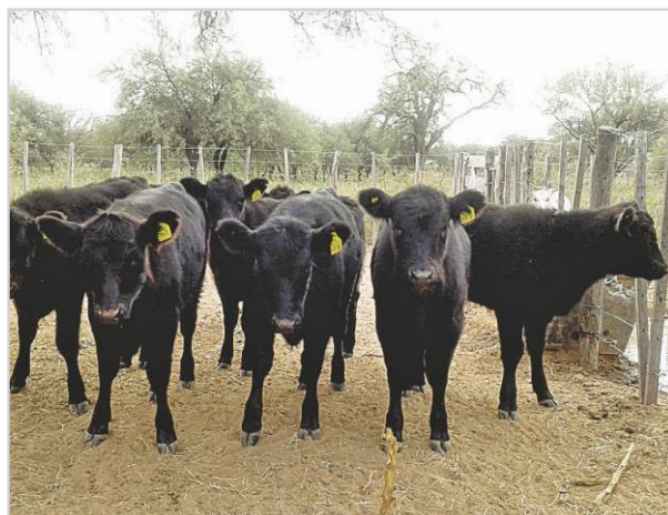
Lote de terneros.