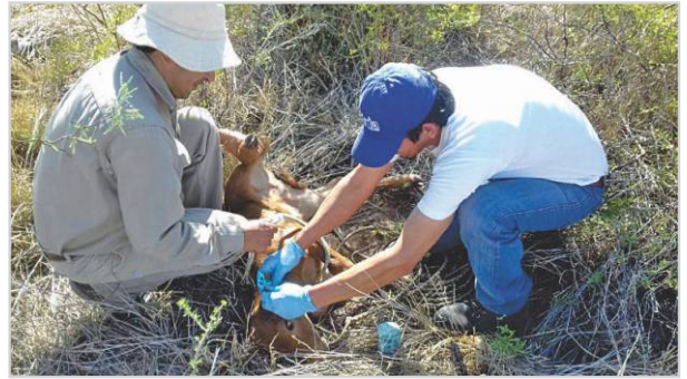
Curación de terneros recién nacidos.