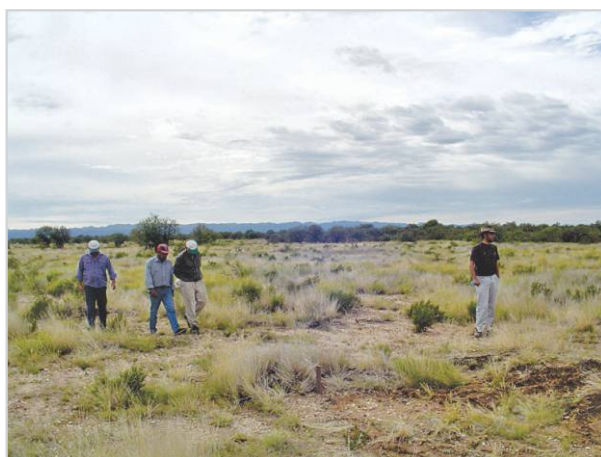
Recorrida y seguimiento de pastizales.