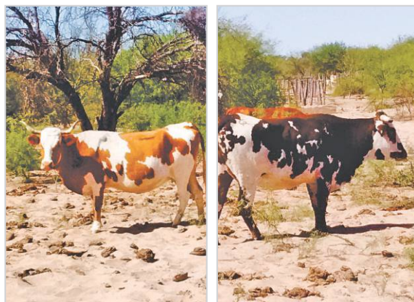
Vacas por parir.