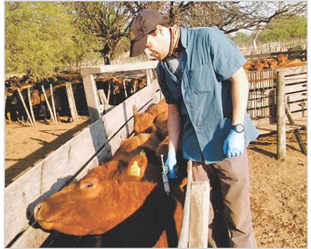
Vacunación al lote de reposición.

dientes). Esto sirve para descartar animales improductivos o viejos o CUTs (vacas que crían el ultimo ternero). Como producto final del diagnóstico de preñez obtendrá el porcentaje de preñez. ☑