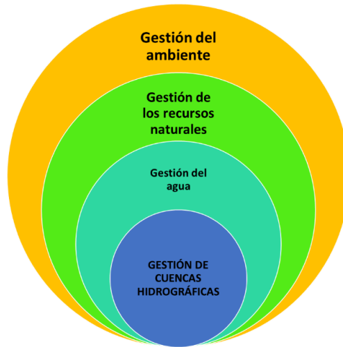
Figura 2. Jerarquización de acciones de gestión a nivel de cuenca.

contaminación de origen residencial, agrícola o industrial, la sobreexplotación de las fuentes de recursos hídricos, las inundaciones/anegamientos, la eutrofización de los cuerpos de agua, la erosión, etc. (Carter, 2007). De ahí parte la necesidad de una adecuada vinculación entre la gestión del agua y la gestión ambiental territorial (Figura 2), recurriendo a prácticas sostenibles en todos los usos del suelo y las actividades que se desarrollen en las cuencas hidrográficas, a fin de prevenir riesgos de origen hídrico, así como garantizar el acceso al agua para el consumo humano, una de las claves para lograr el DS (Dourojeanni y Jouravlev, 2001, Pochat, 2008, WWAP, 2019).