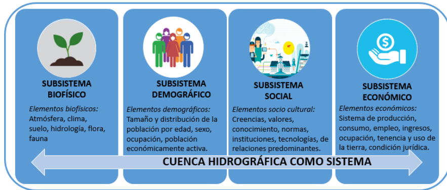
Figura 1. Cuenca hidrográfica como sistema. Fuente: adaptado de Gaspari, Rodríguez Vagaría, Senisterra, Delgado, y Besteiro, (2013).

Un enfoque sistémico del concepto de cuenca hidrográfica supera la idea de reducirla a una superficie de convergencia del escurrimiento hídrico superficial, debido a que se considera a todo el complejo biogeomórfico y humano. Bajo esta concepción, la cuenca hidrográfica representa un espacio físico tangible que permite la concurrencia integral y multisectorial (actividades económicas y productivas). La misma constituye un instrumento valioso del Estado y la sociedad para administrar su actividad, conciliar intereses económicos y sociales, conservar la biodiversidad y permitir un uso sostenido de los recursos naturales representando a una unidad de planificación y gestión para el manejo de los recursos naturales (Gaspari et al. , 2006; 2013; Aumassanne, 2019). Con una perspectiva integral y con el conocimiento sistémico de una cuenca hidrográfica, se considera a ésta, como referencia para proyectar el desarrollo sostenible regional, considerado la capacidad de una sociedad para cubrir las necesidades básicas de las personas sin perjudicar el ecosistema ni ocasionar daños en el medio ambiente, por consiguiente, sin generar impacto ambiental con su actividad productiva (Bruno, 2000). En el estudio y planificación de una cuenca hidrográfica es indispensable la comprensión y aplicación del DS en el uso y manejo de los recursos naturales.