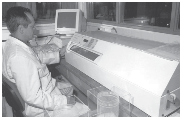
Staple Breaker Model II: Largo, resistencia y pto. de quiebre de mechas.

Tradicionalmente se estima la medida de la resistencia, tirando mechas individuales entre los dedos y aplicando fuerzas de tracción hasta el quiebre. Esto tiene una gran desventaja que son los diferentes espesores de mecha tomados, don-