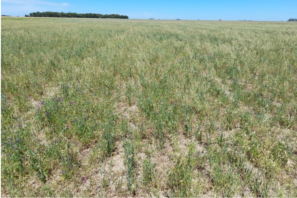
Imagen 11: Avena + vicia, siembra con muy baja densidad, estado reproductivo (01/12/21).