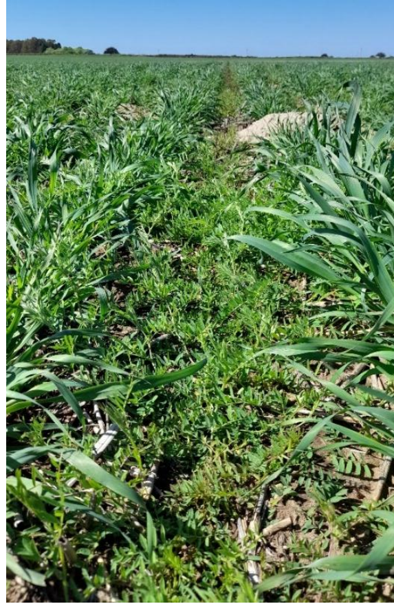
Imagen 4: Avena + vicia en estado vegetativo, siembra en hileras intercaladas. Izq.: 18/08/21, der.: 23/09/21.