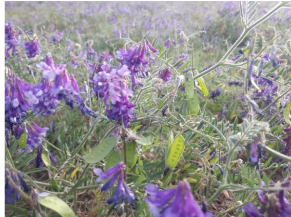
Imagen 22: vicia de resiembra en floración y formación de primeras vainas (21/10/21).