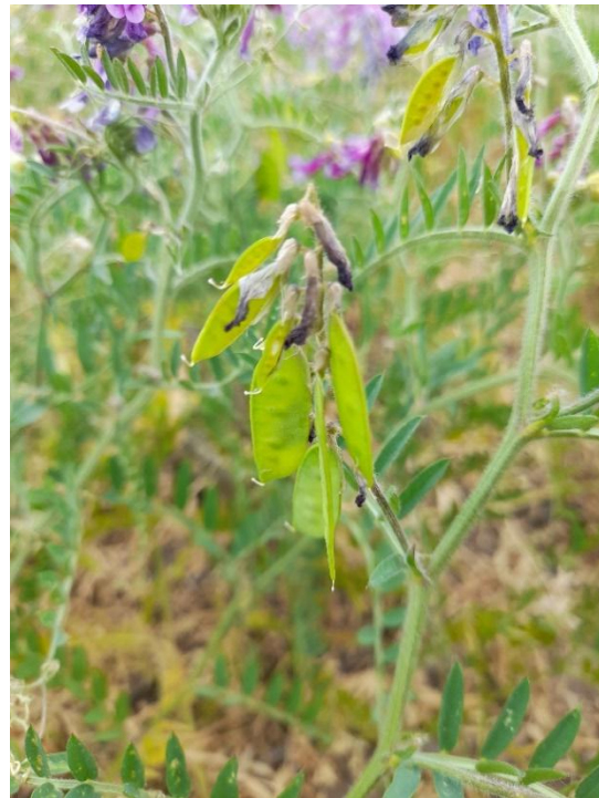
Imagen 16: polinización de vicia mediante abejas melíferas (izq.), y formación de las primeras vainas reproductivas (02/11/21).