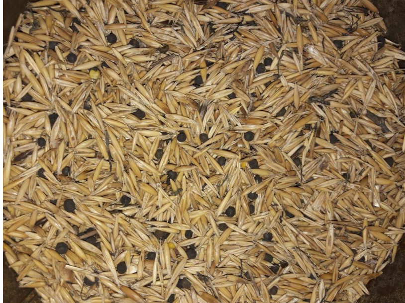
Imagen 9: semilla de avena Máxima + vicia luego de la cosecha, con muy baja proporción de la leguminosa.