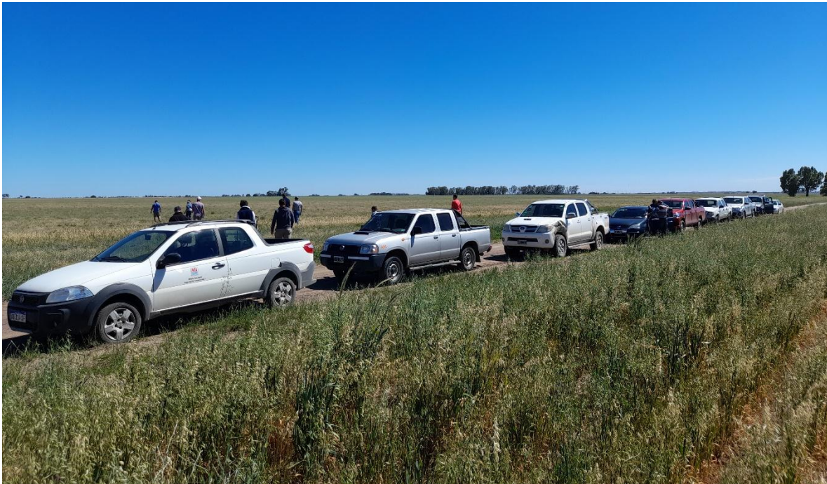
Imagen 3: recorrida de lotes junto a productores y técnicos de la zona (18/11/21)

Los principales aspectos de manejo de la vicia evaluados fueron: densidades, arreglo espacial de plantas, siembras puras y en mezcla con avena, fechas de siembra, control de malezas en postemergencia, control de isoca bolillera y promoción de resiembra natural. Sumado a ello, se consideraron diferentes manejos de los suelos, las labores y la conservación del agua en los mismos.