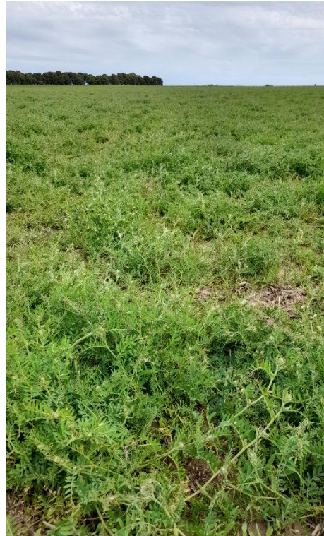
Imagen 20: vicia de resiembra en estado vegetativo inicial (izq.: 18/08/21) y avanzado (der.: 05/10/21)