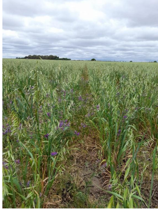
Imagen 5: Avena + vicia siembra en hileras intercaladas. Izq.: fin estado vegetativo (05/10/21), der.: floración (01/11/21).