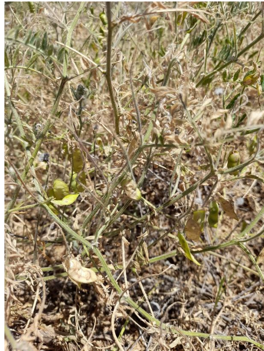
Imagen 25: vicia de resiembra finalizando su ciclo, afectada severamente por el estrés hídrico y térmico y la presencia de isoca bolillera (09/11/21).