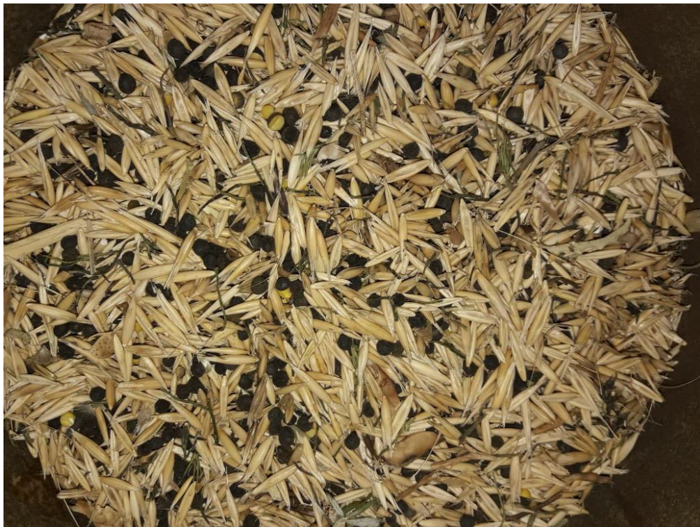
Imagen 12: semilla de avena Máxima + vicia luego de la cosecha. Mayor presencia de la leguminosa debido a menor densidad de plantas de avena en el cultivo.