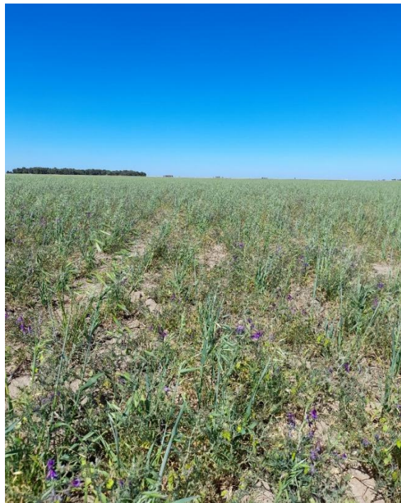
Imagen 10: Avena + vicia, siembra con muy baja densidad y stand de plantas de avena afectado por pulgón. Izq.: estado vegetativo (23/09/21), der.: estado reproductivo (09/11/21).