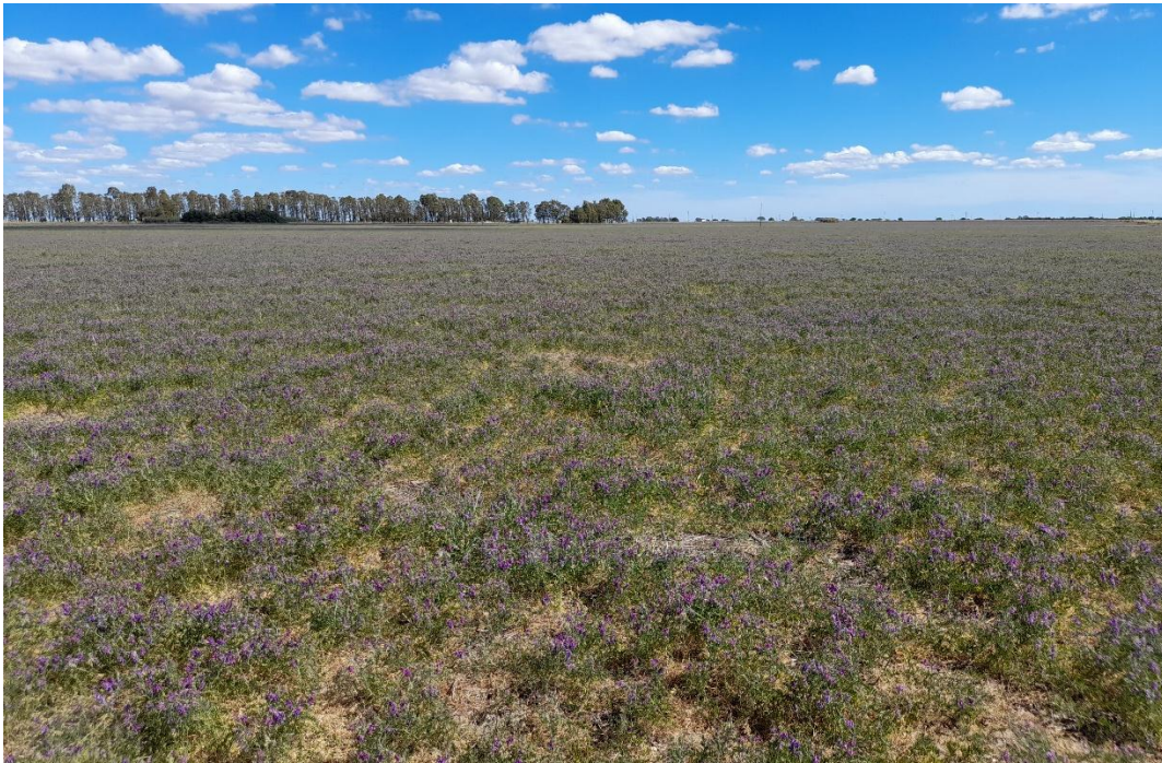
Imagen 15: vicia pura en floración, con crecimiento limitado por estrés hídrico y térmico durante octubre (02/11/21).