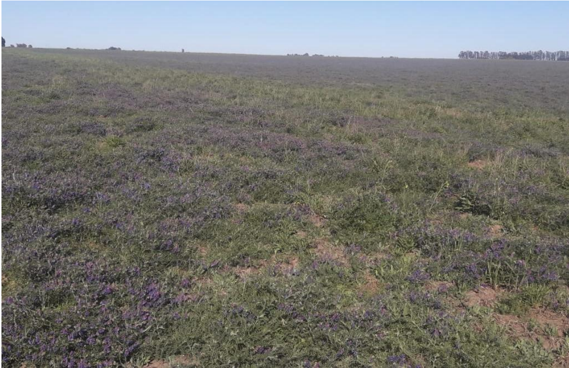
Imagen 21: vicia de resiembra en floración (15/10/21)