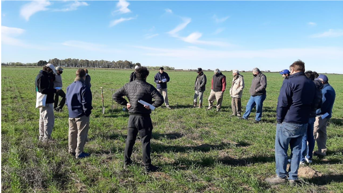
Imagen 1: recorrida de lote de avena + vicia en siembra directa (15/09/21)