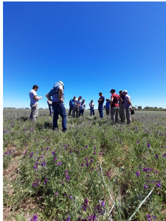
Imagen 2: recorrida de lotes de avena + vicia, y vicia pura en siembra directa (18/11/21)