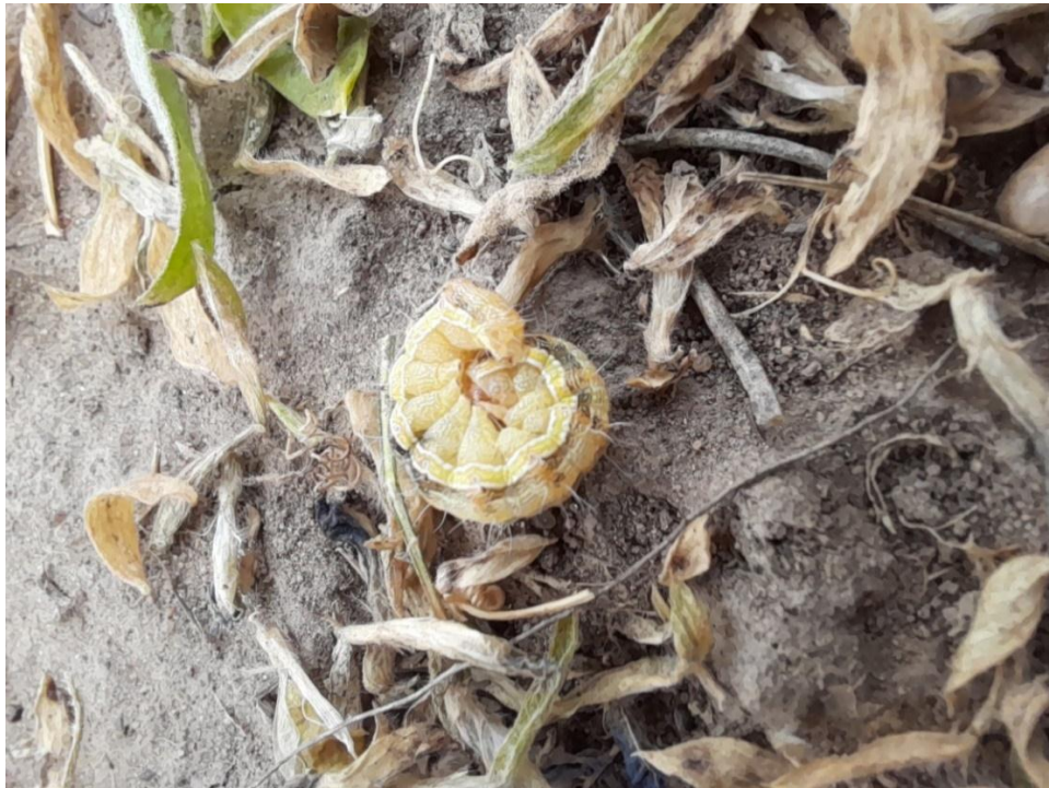
Imagen 24: presencia de isoca bolillera en lote de vicia (01/11/21)