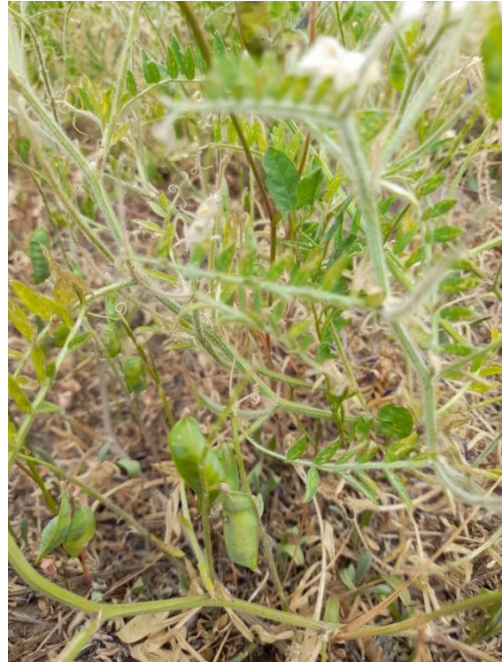
Imagen 23: vicia en estado reproductivo y formación de vainas, en contexto de estrés hídrico y térmico (01/11/21).