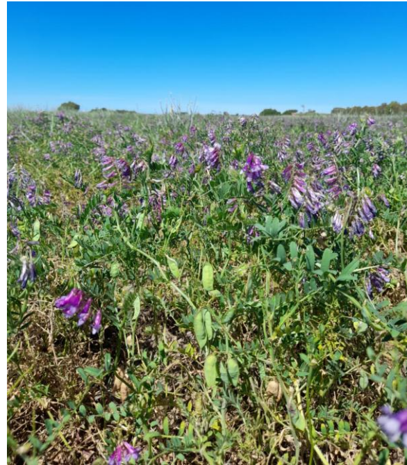
Imagen 17: vicia en recuperación luego de las lluvias, extendiendo su ciclo. Vainas maduras, vainas en formación y flores (29/11/21).