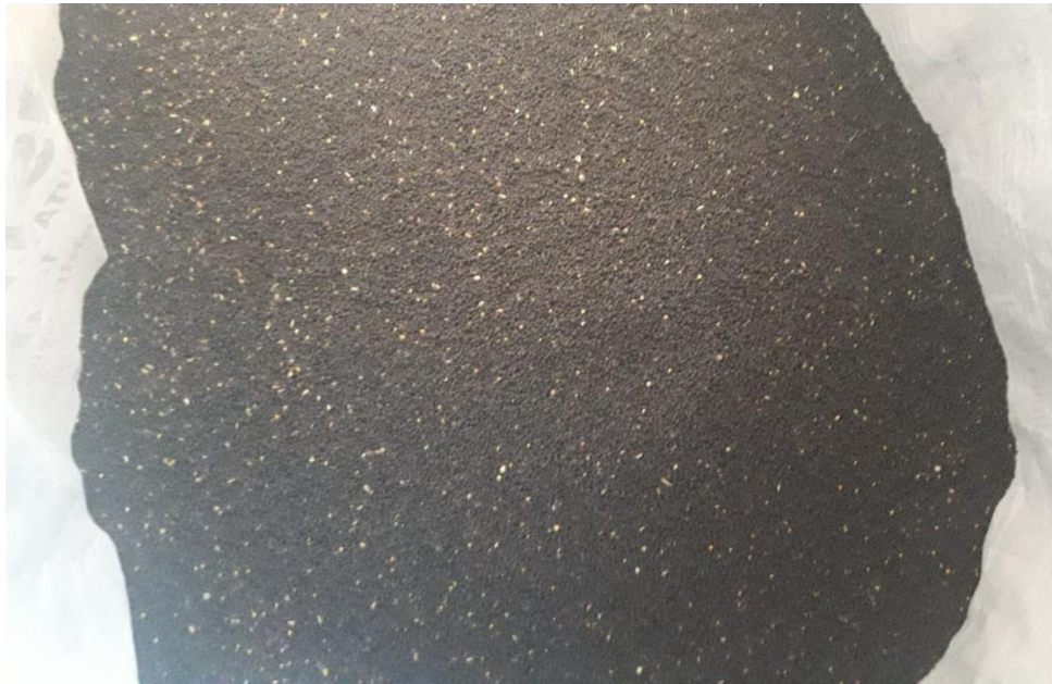
Imagen 19: semilla de vicia maquinada luego de la cosecha.