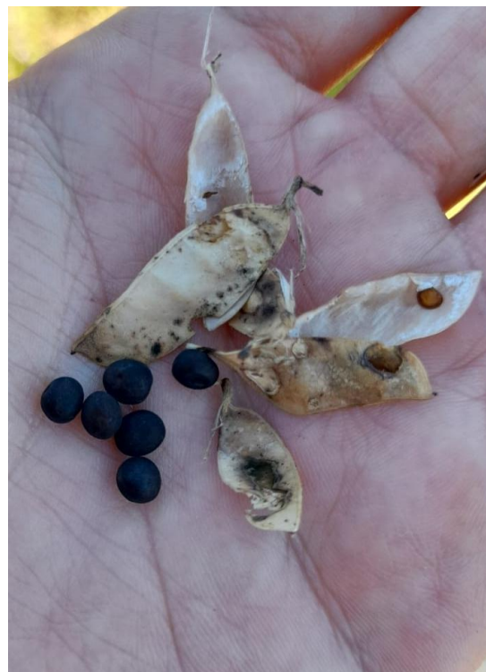
Imagen 18: vainas de vicia en diferente estado de madurez (29/11/21).