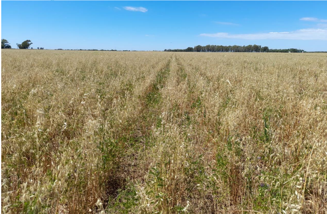
Imagen 7: Avena finalizando su ciclo, vicia verde prolongándolo debido a las precipitaciones de la segunda quincena de noviembre (01/12/21).