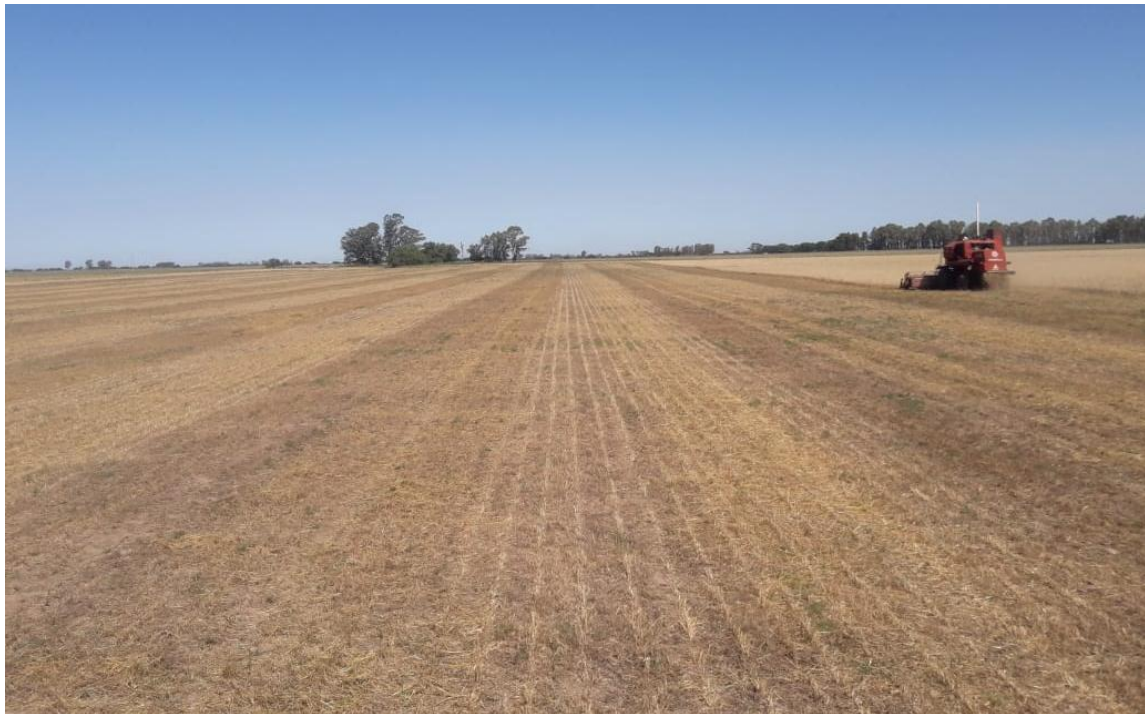
Imagen 8: proceso de trilla de avena + vicia con utilización de flexi, sin aplicación de desecante (26/12/21).