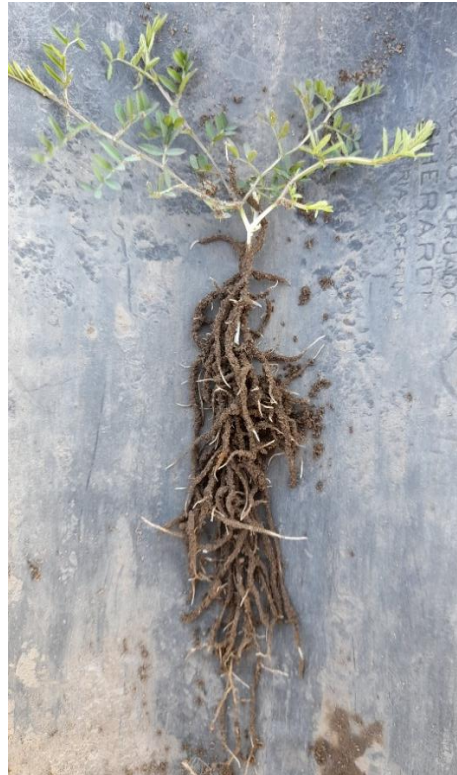
Imagen 13: vicia en estado vegetativo (izq.), con muy buen desarrollo inicial de raíces (der.) (02/09/21).