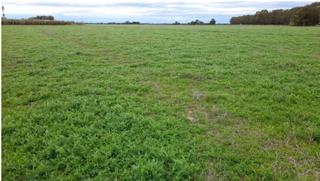
Imagen 14: vicia pura en estado vegetativo y crecimiento desuniforme debido a irregularidades en el relieve del suelo (02/10/21).