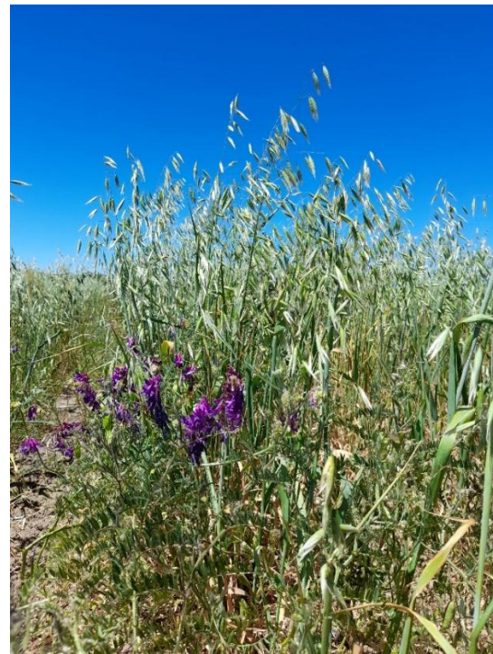
Imagen 6: Avena + vicia en estado reproductivo, siembra en hileras intercaladas (09/11/21).