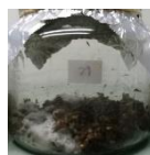
Descarte de molienda trigo