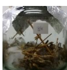
Pajilla de trigo