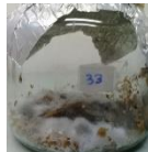
Descarte de galletitas