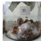
Pasta de zanahoria