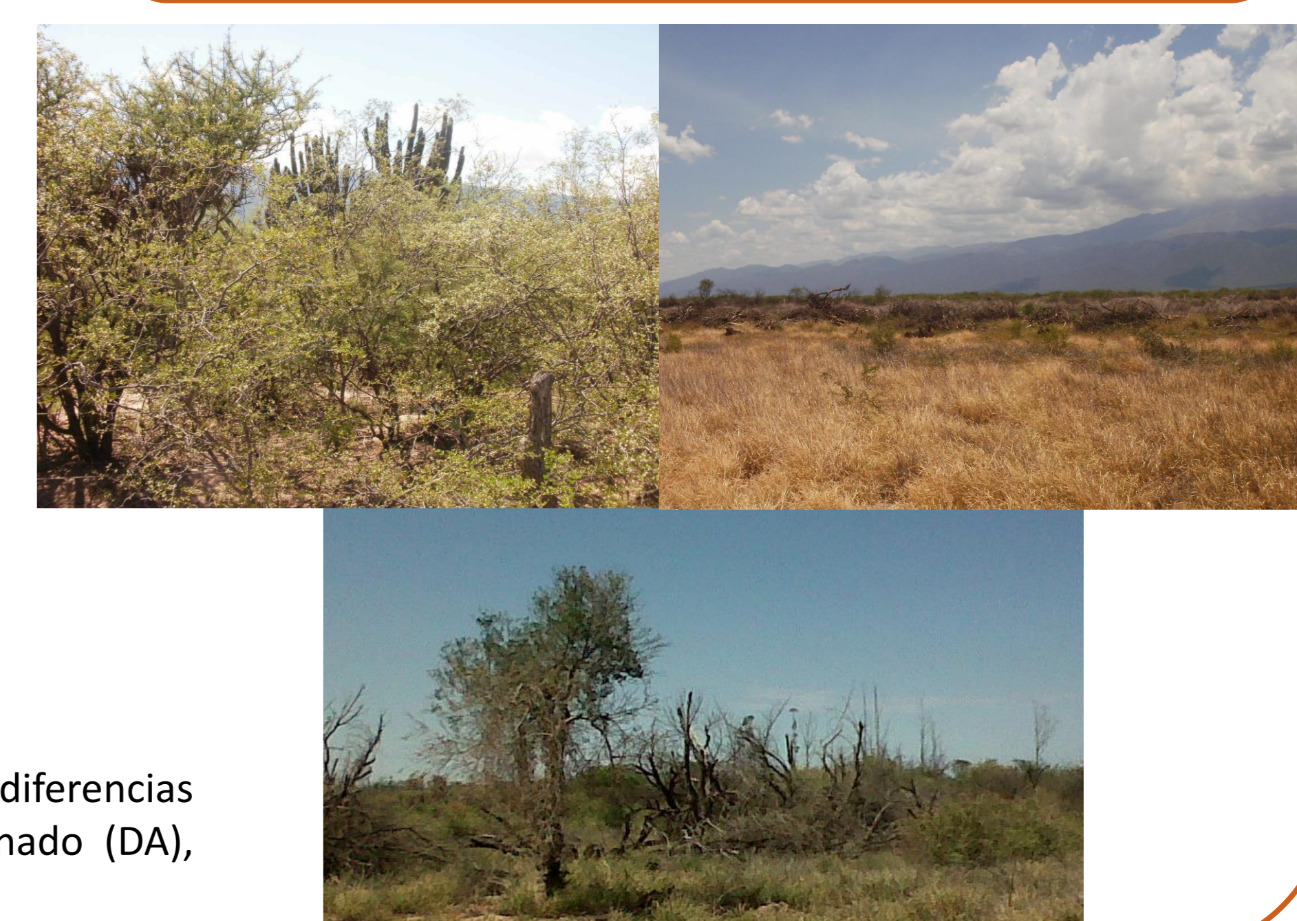
Figuras A, B y C: Letras distintas indican diferencias significativas entre situaciones. Desmonte abandonado (DA), monte natural (MN) y olivos abandonados (OA).

Monte Natural-Desmonte Abandonado-Olivos Abandonados