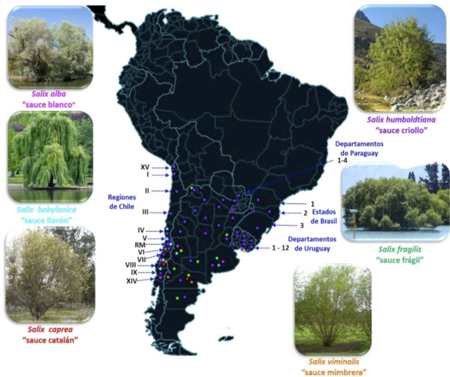
Figura 1 | Distribución de especies de Salix spp. reportadas en América del Sur. Estados de Brasil, 1: Paraná; 2: Santa Catarina; 3: Rio Grande Do Sul. Regiones de Chile, I: Tarapacá; II: Antofagasta; III: Atacama; IV: Coquimbo; V: Valparaíso; RM: Región Metropolitana; VI: O'Higgins; VII: Maule; VIII: Biobío; IX: Araucanía; XIV: Los Ríos; XV: Arica y Parinacota. Departamentos de Paraguay: 1: San Pedro; 2: Central; 3: Paraguari; 4: Ñeembucú. Departamentos de Uruguay: 1: Salto; 2: Paysandú; 3: Soriano; 4: Rivera; 5: Tacuarembó; 6: Durazno; 7: Florida; 8: Canelones; 9: Montevideo; 10: Treinta y tres; 11: Rocha; 12: Maldonado.

Presentamos una especie herbácea que representa un recurso prometedor para mitigar los impactos de degradación ambiental en las franjas ribereñas.