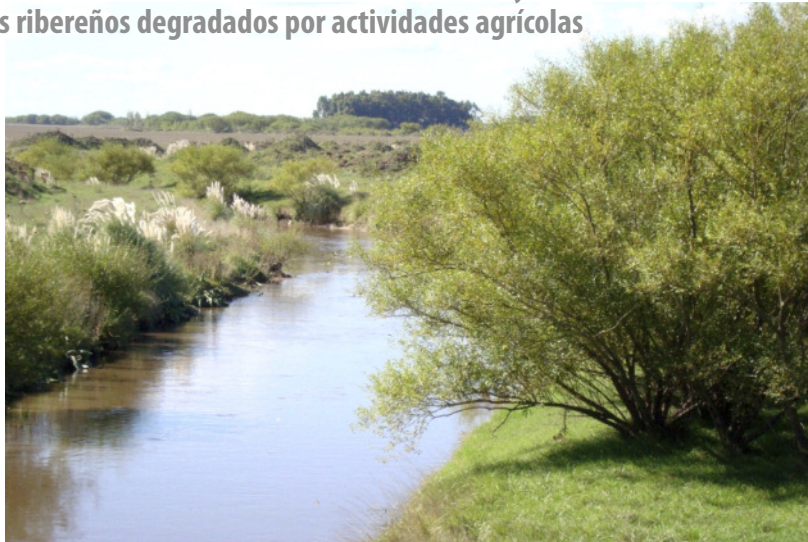
Figura 4 | Ejemplar de Salix fragilis en margen del arroyo Claromecó.

En enero de 2022 se relevaron sitios en los partidos de Tres Arroyos y Coronel Dorrego donde se habían identificado algunos ejemplares relictos de S. humboldtiana durante octubre y diciembre de 2008 y 2009. Con el fin de determinar si las especies