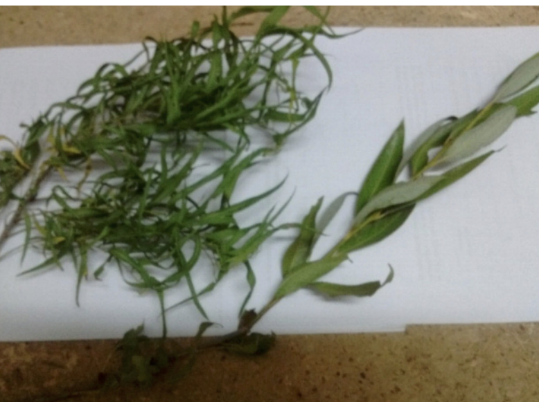
Figura 2 | Hojas de Salix humboldtiana (izquierda) y de Salix fragilis (derecha).

El principal uso del sauce criollo es para la obtención de madera. Su uso comenzó en la época colonial y es la principal causa de la drástica disminución de su población. La madera se caracteriza por ser dura, rojiza y con alta densidad (0,50 g/cm 3 ), superior a la de todos los demás sauces. Se utiliza tanto como combustible, como para la construcción y fabricación de barriles, postes, cajones, ebanistería, mangos de herramientas, embalajes, muebles y aberturas. Durante la colonización fue utilizada como madera de construcciones y hasta para la fabricación de barcasas. Por otro lado, sus ramas delgadas y flexibles se pueden utilizar como mimbre para hacer cestos y muebles. Las ramitas y hojas pueden ser forraje para el ganado, y sus flores producen néctar y polen