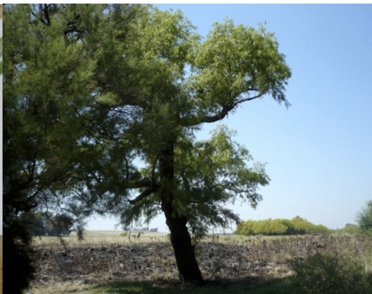
Figura 3 | Ejemplar de Salix humboldtiana en margen del arroyo Sauce Grande.