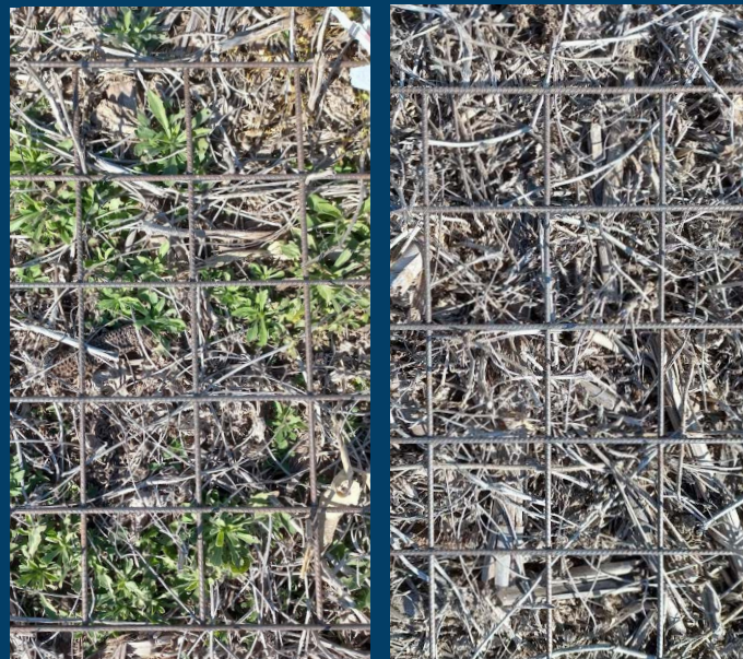
Imagen 3. Evaluación del control de malezas en rastrojo de soja a los 45 DDA. A la izquierda parcela testigo, a la derecha parcela tratada con boquilla aire inducido a 50 l/ha.

A los 45 DDA el uso de boquilla cono hueco y aire inducido con 50 l/ha y 100 l/ha fueron eficaces en el control de la mayoría de las malezas en rastrojo de soja y maíz, sin diferencias entre ellos. En el rastrojo de soja el control de rama negra fue total en todos los tratamientos (Imagen 3).