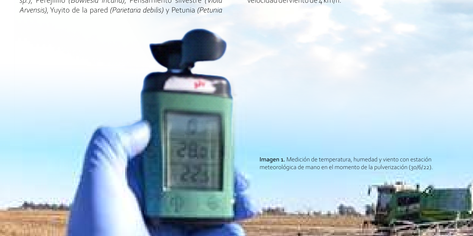
Imagen 1. Medición de temperatura, humedad y viento con estación meteorológica de mano en el momento de la pulverización (30/6/22).

Las condiciones meteorológicas durante la aplicación (8:00 a 9:00 am) se registraron con una estación meteorológica de mano a 1,5 m sobre el nivel del suelo (Imagen 1). En promedio, la temperatura fue de 22,5 °C, la humedad relativa de 30 % y la velocidad del viento de 4 km/h.