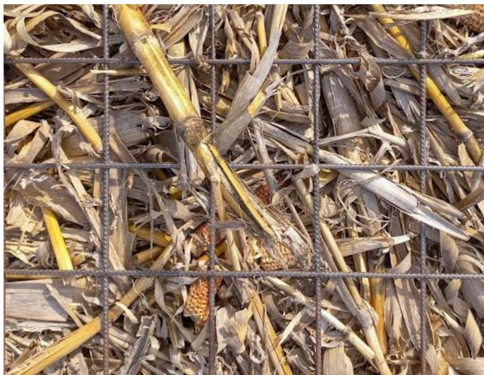
Imagen 4. Control total de malezas en rastrojo de maíz a los 45 DDA con boquilla Aire Inducido a 100 L/ha de tasa de aplicación

*Letras distintas indican diferencias significativas entre tratamientos ( p > 0,05 ).