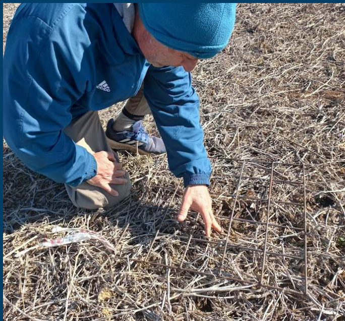
Imagen 2. Relevamiento de control de malezas en áreas de 0.25 m 2

La evaluación del control de malezas se determinó a los 45 días después de la aplicación. En 5 muestreos al azar de 0.25 m 2 se midió el número de individuos por especie en las parcelas testigos y tratadas (Imagen 2)