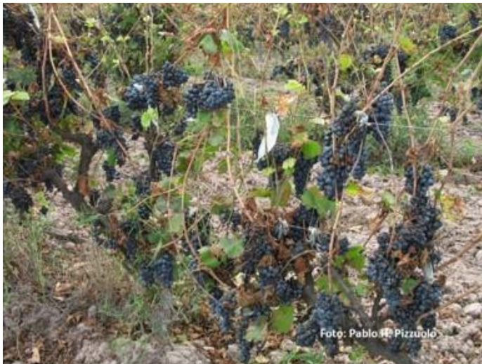
Fig 3. Caída de hojas (filoptosis).