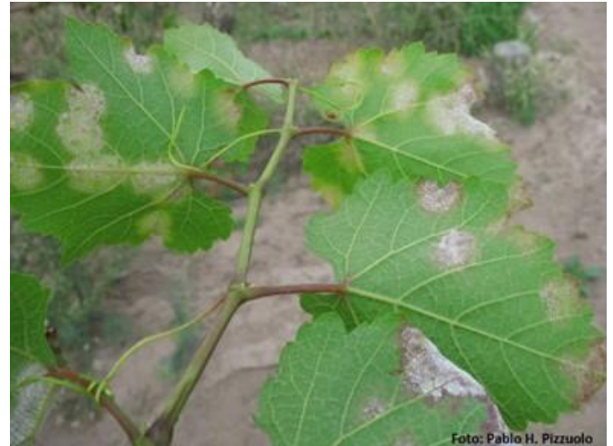
Fig 2. Manchas cloróticas cubiertas por eflorescencia blanquecina (signo) en el envés de las hojas.

verde grisáceo. Cuando la infección de los racimos se produce más adelante, luego que las bayas tienen el tamaño de una arveja, sólo se verán afectadas algunas bayas contiguas o posteriormente bayas individuales. Estas se reconocen por el retraso en su crecimiento, la tonalidad verde grisácea inicial o parda más adelante. Si el tiempo es favorable para el patógeno, a partir de las partes afectadas del racimo aparecerán los signos. Desde el envero en adelante el patógeno ya no afectará a los racimos. Si bien en nuestra zona los pámpanos no se han visto afectados hasta el presente, la sintomatología que podría observarse en ellos es un retraso del crecimiento, deformación (forma de “S”) y aparición de zonas necrosadas.