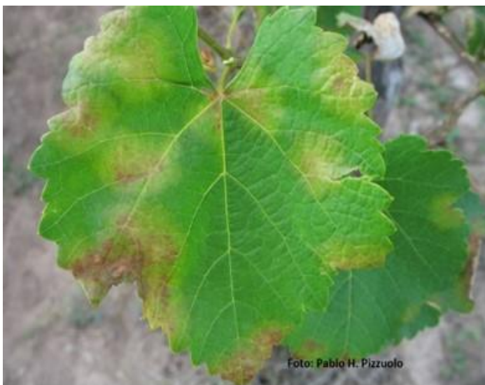
Fig 1. Peronóspora de la vid: manchas cloróticas, algunas ligeramente amarillentas, y otras rojizas.