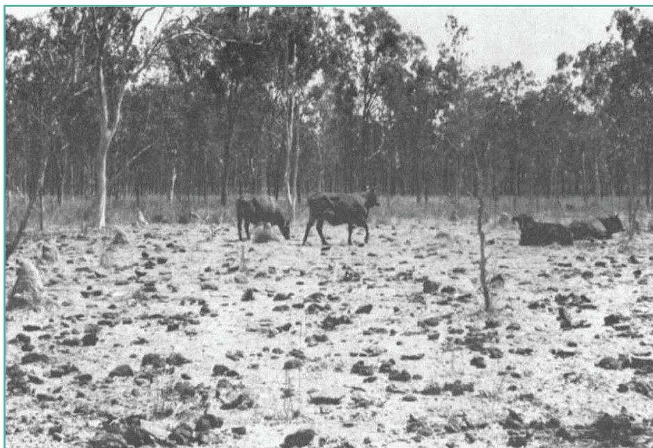
Figura 3: Campo australiano previo a la introducción de la fauna coprófaga.

los campos. Encontraron, por ejemplo, que eran muy buenos en la reducción de poblaciones de moscas perjudiciales para el ganado, ya que estas moscas compiten con los escarabajos para poner sus huevos en el estiércol, y los escarabajos les ganan porque son más rápidos. También se investigó mucho acerca de los efectos de los antiparasitarios veterinarios que se aplican en el ganado sobre los escarabajos estercoleros. Estos productos (como la ivermectina) son eliminados por las heces del ganado, y cuando la fauna coprófaga las consume o manipula se ve afectada de formas variadas. Este contacto puede generar mortalidad en adultos, en larvas, e infertilidad de huevos, hasta incluso incapacidad de cumplir ciertas funciones en generaciones posteriores que hayan estado en contacto con las heces contaminadas. También existen muchos estudios sobre la modificación química y física del suelo, los beneficios generados por la bioturbación y el ciclado de nutrientes con la actividad de la fauna coprófaga, aunque estos temas deben seguir siendo investigados con mayor profundidad.