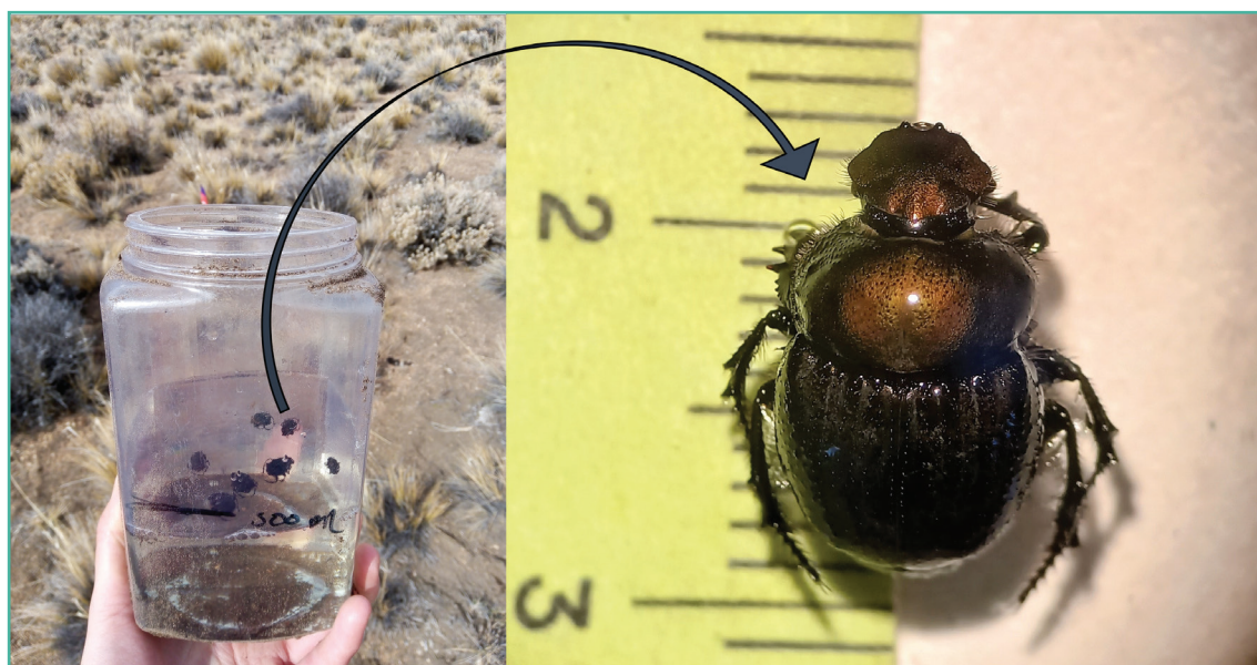
Figura 4: Escarabajo coprófago patagónico.

la fauna coprófaga relacionada con la producción ovina. Pusimos trampas con un cebo fresco de boñigas de oveja y los insectos interesados en este recurso comenzaron a aparecer (Figura 4). Ahora estamos un pasito más adelante en el camino de conocer qué tipo de insectos coprófagos tenemos en nuestras estepas patagónicas, para poder avanzar en el estudio del rol que juegan estos insectos en las producciones ganaderas de la región. Mientras tanto, conocer de su existencia nos ayuda a empezar a reconocerlos en el campo para valorarlos y cuidarlos.