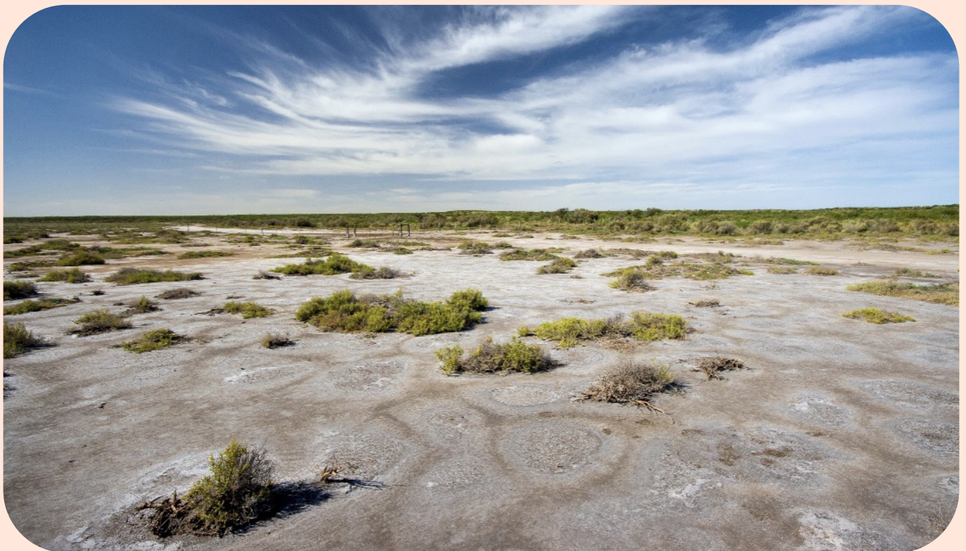
La foto fue finalista del concurso fotográfico Global Symposium on Salt-affected Soils organizado por FAO. Autor: Guillermo A. Schulz (Cartografía de Suelos - Evaluación de Tierras Instituto de Suelos. CIRN-INTA Castelar).

El primer mapa de suelos afectados por sales de Argentina utilizando técnicas de Mapeo Digital.