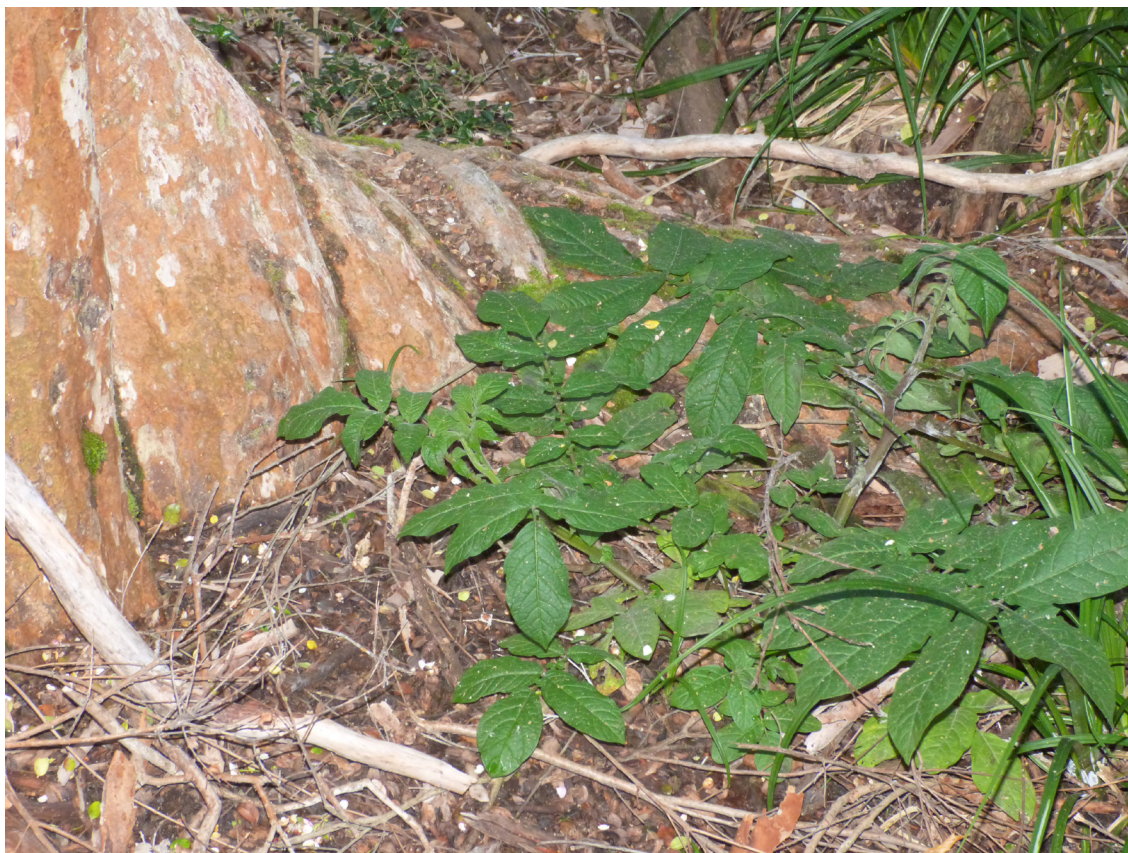
Fig. 3. Solanum palustre creciendo en el PN Los Arrayanes (Provincia de Neuquén) en los bosques andino-patagónicos.

S. microdontum , ya se ha registrado en seis áreas protegidas, pero las mismas no incluyen el extremo sur de su área de distribución en la provincia de La Rioja; en esta última se hibridiza con S. kurtzianum y el híbrido resultante ha sido descrito como S. ×rechei (Okada & Hawkes, 1978) y tanto el híbrido como las especies parentales se encontrarían en un estado vulnerable en esta región.