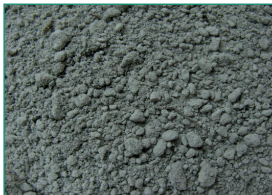
■ Muestra 6: Villa La Angostura.

de aireación. En cambio, las de menor tamaño de partículas fueron más densas y con mayor capacidad de retención de agua. Por esta razón, los sustratos que se formulan con cenizas volcánicas deben ser complementados con otros materiales que mejoren la relación de poros con aire y agua.