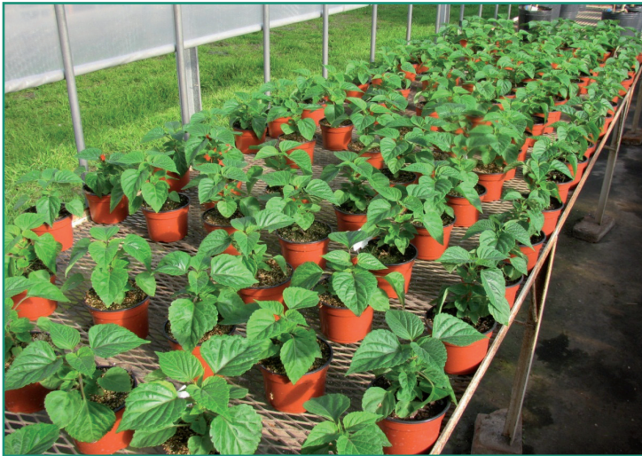
■ Foto 2: Evaluación de mezclas de sustrato con ceniza volcánica en el cultivo de plantas de coral ( Salvia splendens ).

50% de ceniza mezcla, considerando la mayor masa fresca y seca aérea y radical que presentaron las plantas evaluadas.