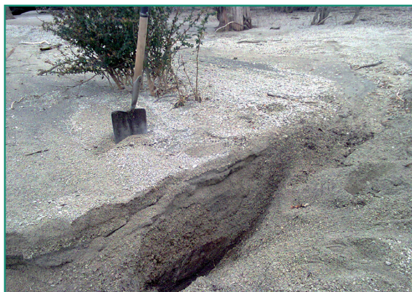
■ Foto 1: Depósito de ceniza volcánica en perfil suelo de Villa La Angostura.

49" Longitud Oeste) (Muestras 3, 4 y 5). Las muestras de Neuquén fueron tomadas en la ciudad de Villa La Angostura (40° 46' 50" Latitud Sur, 71° 39' 36" Longitud Oeste) (Muestras 6 y 7), en Bahía Huemul (40° 58' 04" Latitud Sur, 71° 20' 56" Longitud Oeste) (Muestras 8 y 9) y en la Estancia Collón Cura (40° 08' 46" Latitud Sur, 70° 42' 11" Longitud Oeste) (Muestra 10).