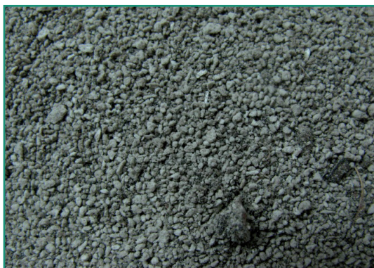
■ Muestra 2: San Carlos de Bariloche.