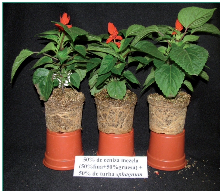
■ Foto 3: Crecimiento de plantas de coral ( Salvia splendens ) bajo cultivo en maceta con 50% de sustrato mezcla ceniza volcánica y 50% de turba sphagnum .