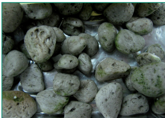
■ Muestra 1: Costa Lago Nahuel Huapi.

Las cenizas volcánicas tuvieron propiedades químicas favorables para su uso como sustrato, principalmente por su bajo contenido de sales. En cuanto a las propiedades físicas, las cenizas volcánicas de mayor tamaño de partículas fueron menos densas y con mayor porosidad