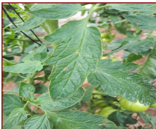
Figura 6. Mancha Gris

Mancha gris ( Stemphylium lycopersici ): produce lesiones en los folíolos de color castaño, con el centro más claro y puede llegar a rajarse el tejido en el centro de la lesión. Solo afecta hojas y progresa en forma acrópeta produciéndose defoliación de las hojas basales más afectadas. La favorece condiciones de clima cálido y húmedo. Figura 6.