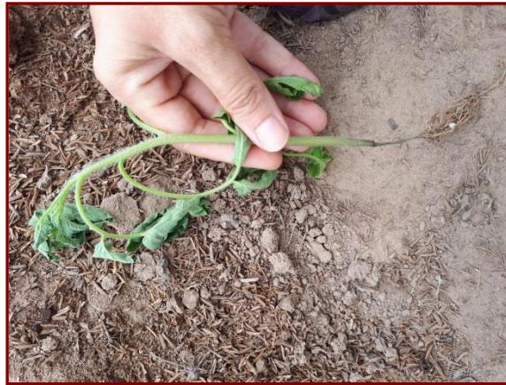
Figura 4. Damping-Off

posemergencia. Al trasplante provocan pudriciones de raíces, tallos descoloridos, marchitamiento y finalmente la muerte de la planta. Figura 4.