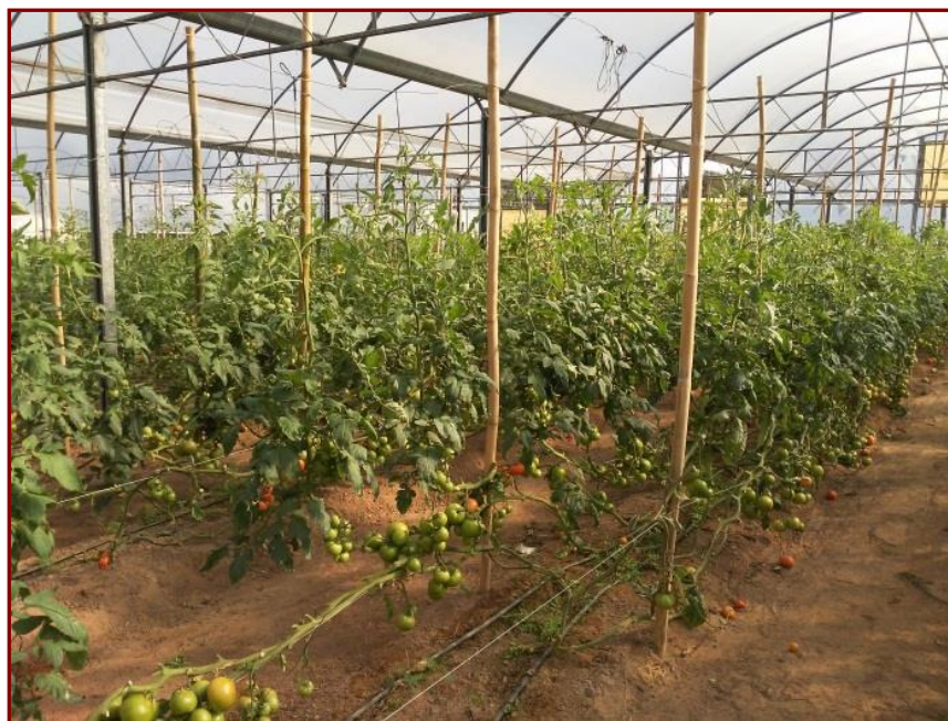
Figura 1. Tomate bajo invernadero. 2022 Fuente: Ingeniero Roberto Pacheco. 2022

Para finalizar, el tipo de cambio oficial al momento de realizar los costos es un dólar a $103.