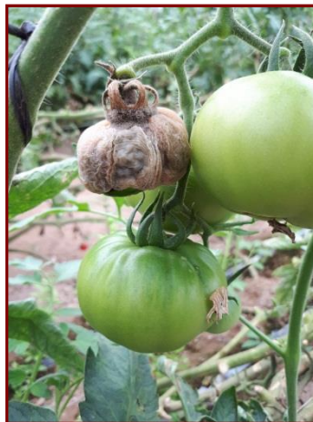
Figura 5. Botrytis

Moho gris o tizón de la flor: lo causa el hongo Botrytis cinerea y lo favorecen las condiciones ambientales bajo cubierta. El daño inicial se observa en flores o ramilletes florales que se cubren de eflorescencia gris. Cuando las condiciones de higrometría bajo cubierta son altas puede producir podredumbre blanda de frutos y lesiones acuosas en hojas. Figura 5.