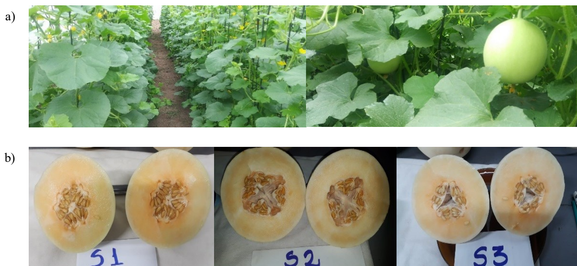
Figura 2. a) Plantas en plena floración y fructificación b) Aspecto interno de los diferentes cultivares.

El fruto de melón a diferencia que los que se producen a campo en la zona de estudio presenta pulpa color naranja (figura 2 b), es el caso de los tres cultivares evaluados con característica de tipo Orange Honey Dew.