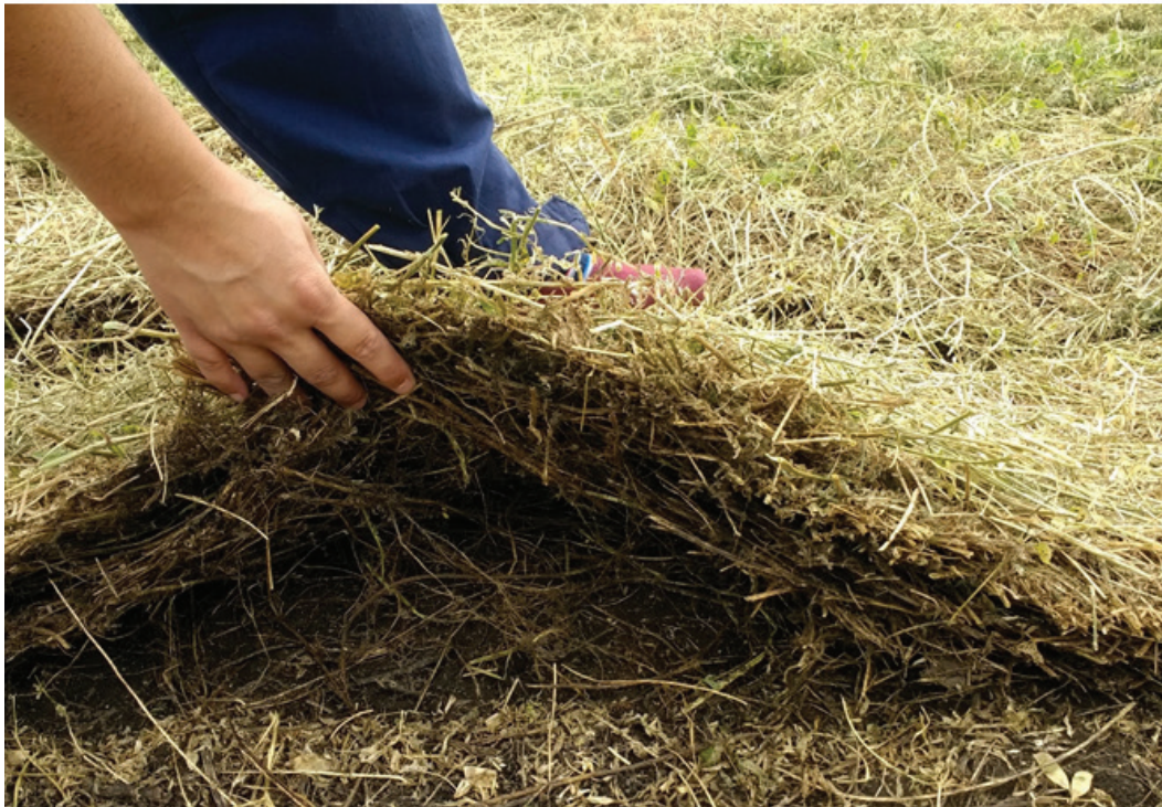
Figura 1. Mantillo generado por el cultivo de cobertura de Vicia villosa , en el momento de la siembra del cultivo de maíz. Ensayo de larga duración Chacra Experimental de Bellocq, campaña 2018-2019.