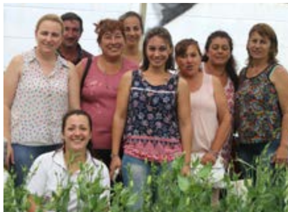
Grupo de floricultoras

En el caso del capital social, el acceso a medios de comunicación y transporte, así como la construcción de una identidad social, son características de peso en los grupos analizados. Cabe señalar que, aunque los lazos son fuertes y las redes formadas presentan cierta densidad social, el número de acciones colectivas organizadas sigue siendo bajo. En la dimensión capital humano se observa que el estado de salud de la población rural es relativamente bueno, así como el acceso a servicios de salud y tratamiento. Sin embargo, la búsqueda de oportunidades de empleo y cualificación profesional se ha señalado en varias ocasiones como principales motivos para el flujo migratorio rural-urbano que resulta en el vaciamiento del hogar y, por consiguiente, disminución de la fuerza de trabajo. Las dificultades para permanecer en el sistema educativo ante la necesidad de generar ingresos familiares repercute en el nivel educativo de estas familias y sus oportunidades laborales.