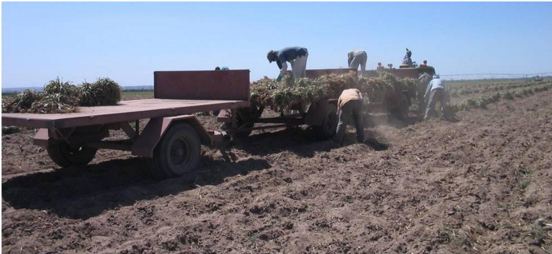
Figura 2 - Operación de carga en campo entre cordones

Los operarios que cargan apoyan los atados de ajo sobre la planchada del acoplado, mientras que el operario que acomoda pisa la planchada (por un pasillo entre franjas de atados), sin afectar a los bulbos.