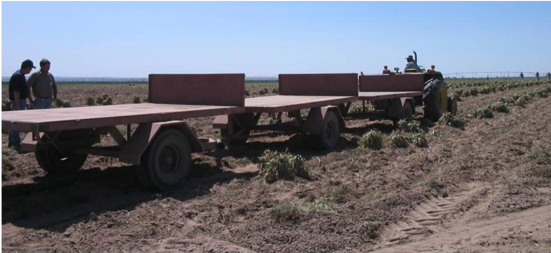
Figura 1 – Acoplados autovolcadores en tándem de carga de traslado de ajo fresco

Por otra parte muestra amplias prestaciones para otras tareas agrícolas convencionales y complementarias de carga y traslado.