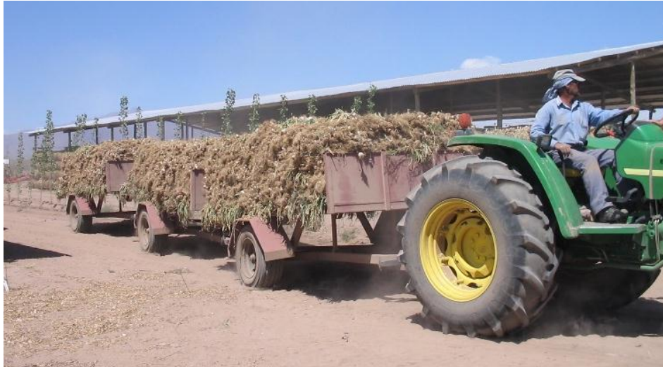
Figura 4 - Acarreo del tándem hasta secaderos

La carga útil de cada acoplado será algo mayor a 5 m 3 lo que admite entre 625 y 650 atados de 4 kg cada uno, equivalente entre 2.500 kg y 2.600 kg (Figura 4).