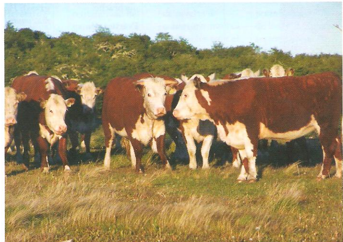
Sistema silvopastoril en bosques de ñire en Patagonia (Tierra del Fuego) con ganado vacuno.

A esto se le suma que en algunas áreas no existe seguridad jurídica de la tenencia de la tierra y que es bajo el valor de los productos madereros proveniente de los raleos (principalmente el uso es leña, postes y varas). Por esto, resultan prioritarias las acciones relacionadas con políticas forestales y planeamiento de uso del bosque de ñire y la administración y utilización del recurso. En el contexto de mejoras de planes de manejo para los SSP en bosque nativo -a nivel predial y regional- existe la perspectiva cierta que las Direcciones de Bosques de las provincias cuenten con pautas de manejo en el marco del Plan de Manejo Sostenible - Modalidad Silvopastoril dentro de la Ley Nacional de N° 26.331 sobre Presupuestos Mínimos de Protección Ambiental de los Bosques Nativos, donde se podrá tener objetivos ganaderos y madereros o solamente ganaderos pero contemplando la persistencia del bosque y tendiendo a aumentar el valor agregado de la madera, en el que las intervenciones permitidas son lo suficientemente moderadas para que el bosque siga manteniendo los atributos de conservación de la categoría II (Amarilla) o las recupere durante el transcurso del plan.