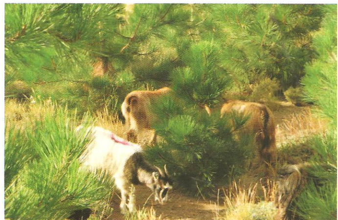
Sistemas silvopastoriles con Pino ponderosa Patagonia Norte (Neuquén) pastoreados por cabras criolla.

La provincia de Corrientes es una de las principales zonas con bosques cultivados del país. Cuenta con 6 millones de hectáreas de pastizales donde se desarrolla una ganadería pastoril. El sistema tradicional de cría de la provincia evolucionó a sistemas integrados de cría, recría e invernada. Entre 2002 y 2013, la superficie forestada pasó de 283.028 a 500 mil ha, y como consecuencia de esto, la superficie ganadera se redujo por el avance de plantaciones mayoritariamente con pinos y eucaliptos. La adopción de los SSP entre productores ganaderos se basa en diversificar la producción y mejorar la rentabilidad del sistema tradicional, contándose con cerca de 50 mil ha bajo estos sistemas con diferentes grados de tecnología aplicada.