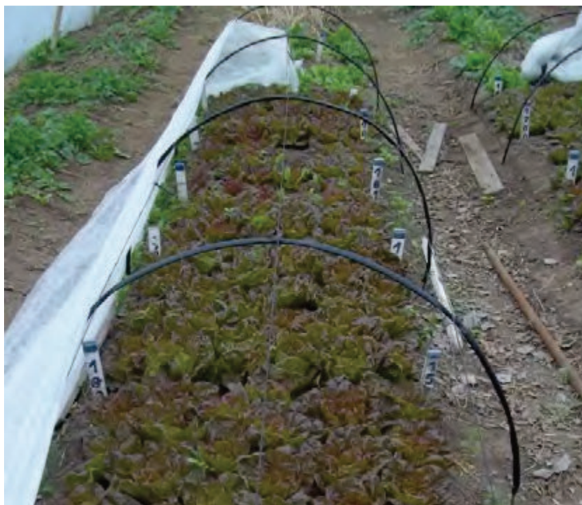
Figura 2. Parcelas de cultivo de lechuga bajo cubierta en camellones protegidos con tela anti helada. Estado del ensayo previo a la cosecha.

La variable peso de las plantas a la cosecha sí verificó los supuestos necesarios para una análisis de ANOVA de un factor (normalidad y homocedasticidad). Los resultados del peso de las plantas a la cosecha mostraron que los tratamientos con adición de bocashi (T2 y T3) presentan diferencias significativas respecto al tratamiento testigo ( p < 0,0067 ). Tabla 2.