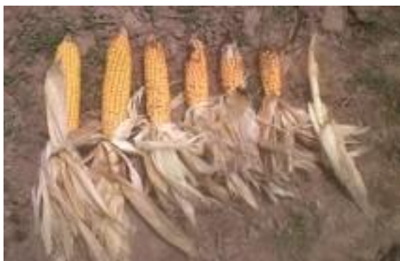
Imagen 4: distintos tamaños de espiga de maíces afectados por la falta de agua..

6) Llene rápidamente el silo o la bolsa, compacte adecuadamente, cubra y selle el silo común tan pronto como haya terminado de llenar. Esto evitara las pérdidas de materia seca durante el almacenaje.