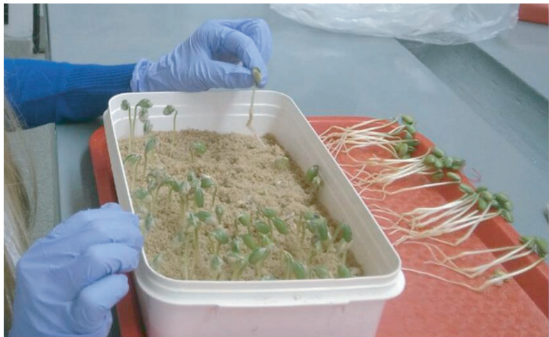
Evaluación de plántulas de soja en la Prueba de Germinación