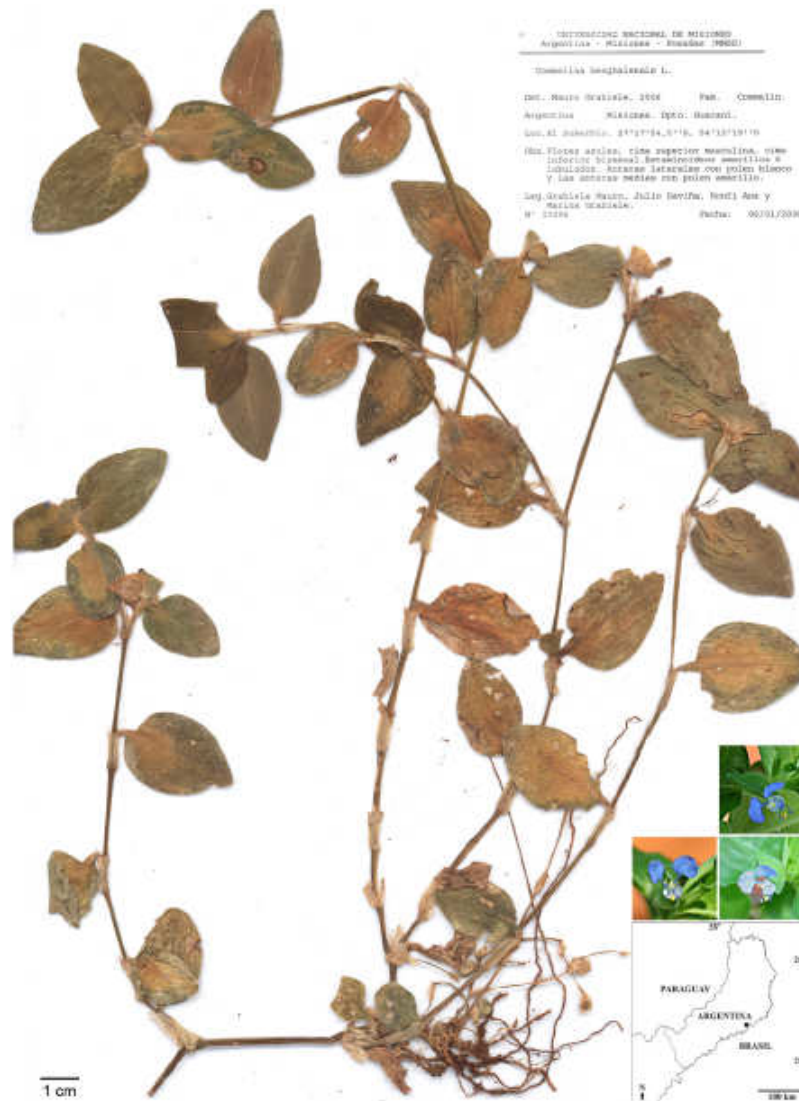
FIGURA 1. Ejemplar de herbario de Commelina benghalensis (Mauro Grabiela et al. 94, MNES). Detalle de las flores y del lugar donde fue coleccionada.

centromérico (i) y se agruparon en orden decreciente dentro de cada clase. Los satélites fueron clasificados según Battaglia (1955). Al menos 10 metafases óptimas fueron usadas para la confección del idiograma, para el cual se usó el software AUTOCAD 2007. La medición de la longitud de los brazos cromosómicos y satélites se realizó mediante dibujos en cámara clara (x2600). La asimetría cariotípica fue estimada usando los índices A_1 y A_2 de Romero Zarco (1986) y las categorías de Stebbins (1971).