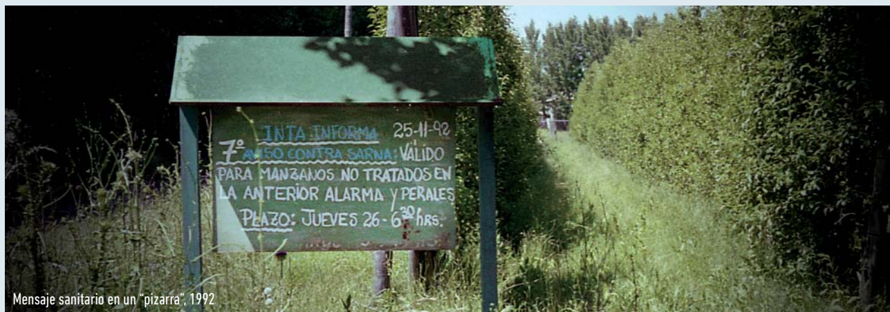
Mensaje sanitario en un "pizarra", 1992

A partir de ese momento, la radio se convirtió en una necesidad insoslayable hasta el día de hoy. A pesar que la difusión de este tipo de mensajes siempre representa un problema cuando los avisos sanitarios caen un fin de semana, momento en el que estas emisoras priorizan su programación gauchesca.