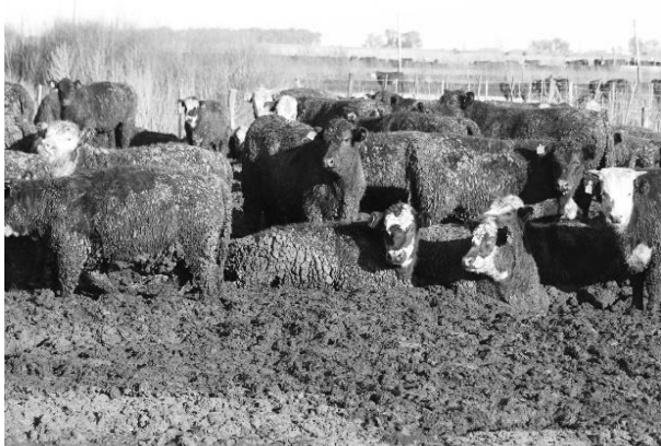
Foto 1. Presencia de barro en corrales de engorde.