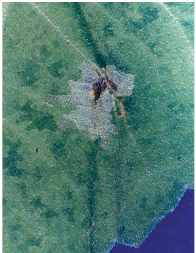
Figura 4. Mina de Calycomyza platyptera en hoja de girasol.