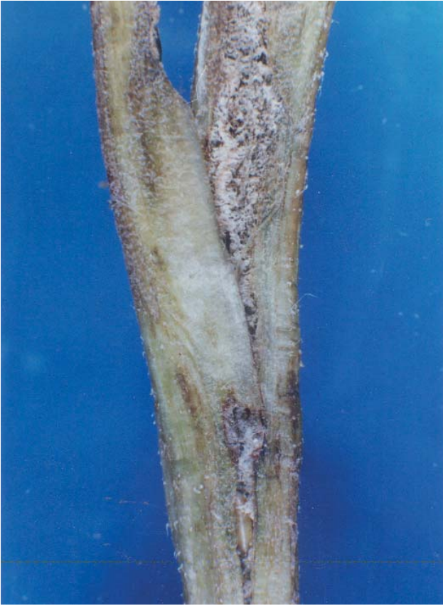
Figura 1. Daño de Melanagromyza cunctanoides en tallo de girasol.