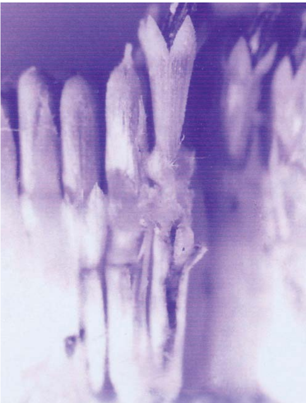
Figura 2. Daño por Melanagromyza minimoides en inflorescencia de girasol.