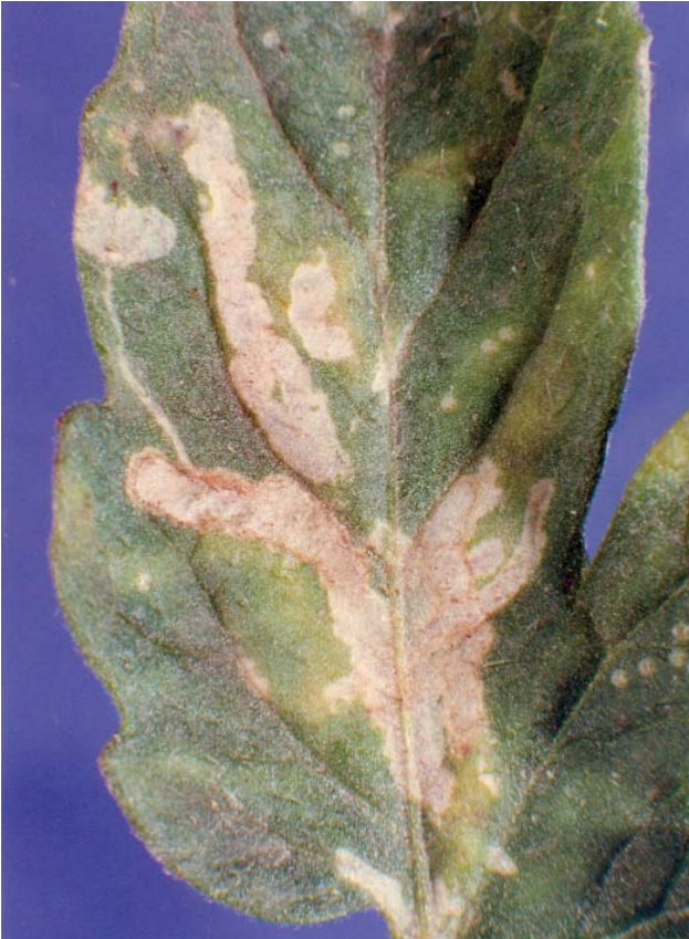
Figura 5a. Daño de L. huidobrensis