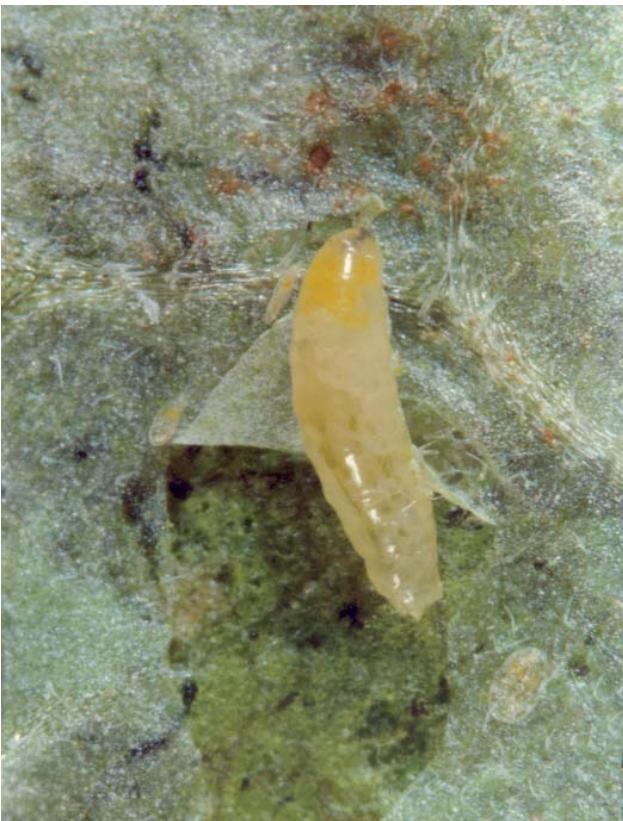
Figura 5b. Larva de L. huidobrensis