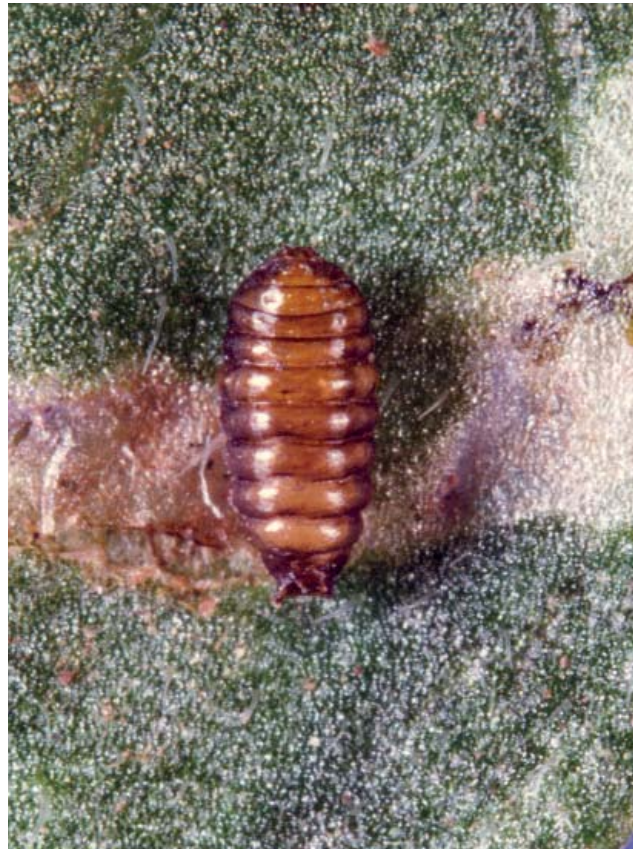
Figura 5c. Pupa de L. huidobrensis