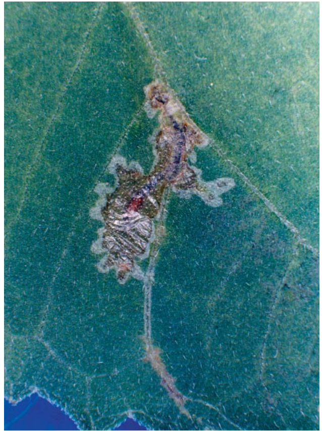
Figura 3. Mina de Nemorimyza maculosa en hoja de crisantemo.