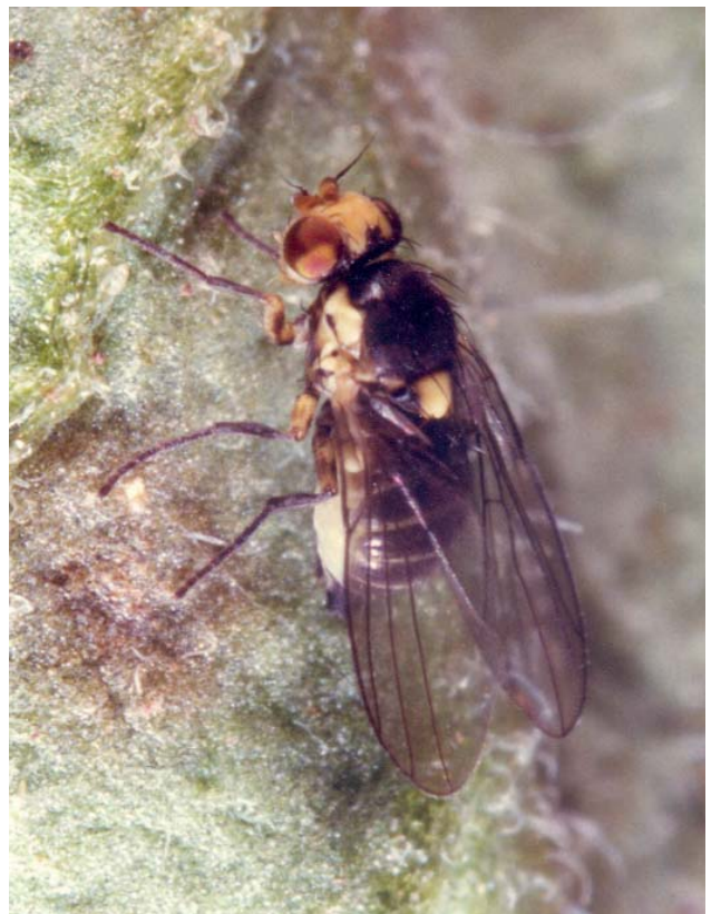
Figura 5d. Adulto de L. huidobrensis