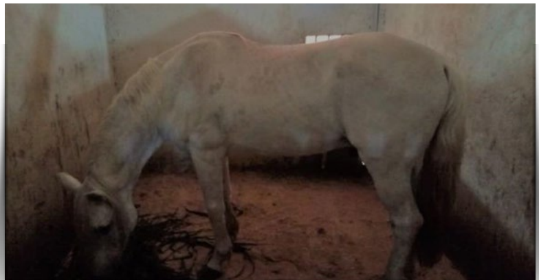
Figura 2. Caballo en establo del establecimiento de Matinhos.

En las entrevistas realizadas en relación a las actividades de cabalgatas, se encontró que el cuidado del animal está a cargo de personal idóneo y también este personal es el responsable del servicio de cabalgata en el emprendimiento. Los 15 caballos son mantenidos en establos individuales con alimentación y cuidados planificados ( Figura 2 ). Los mismos son utilizados para el servicio durante los fines de semana en las estaciones de otoño, invierno y primavera. En cambio, en el verano la demanda es diaria dada la afluencia masiva de turistas que llega al litoral Paranaense, principalmente a las playas de Matinhos.