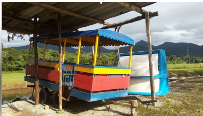
Figura 4. Carro de transporte de turistas del establecimiento de Matinho.

En las entrevistas surgieron relatos de los incidentes más comunes, tales como: "...que los turistas suban con celular a cabalgar y quieran sacarse una autofoto (selfie), produciendo una molestia al caballo (susto) y una inestabilidad que en algunos casos se produce un accidente...; o también que: "...existen turistas que no advierten su desconocimiento de cabalgar y exigen una cabalgata veloz al caballo, produciendo incidentes que puede afectar la integridad física de la persona y/o el caballo.."