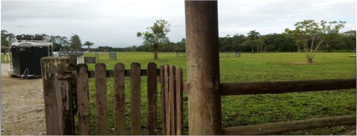
Figura 1. Emprendimiento de cabalgata de Matinhos.

Este emprendimiento se enfoca a la actividad por día y está dedicado a la familia. Se publicita como: “(...) una finca con varios atractivos para la familia. Con más de 363 ha de área verde, es ideal para aquellos que buscan relajarse, divertirse con amigos y pasar un buen rato con los miembros de la familia. ¡Es decir, queremos que tengas un gran día con nosotros! Trae a tus amigos y familiares”.