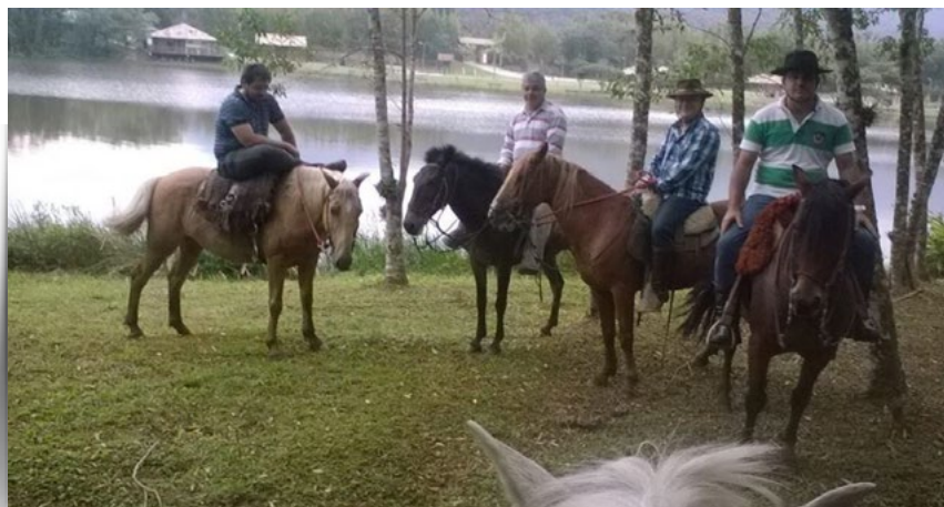
Figura 3. Turistas cabalgando.

En las entrevistas surgieron relatos de los incidentes más comunes, tales como: "...que los turistas suban con celular a cabalgar y quieran sacarse una autofoto (selfie), produciendo una molestia al caballo (susto) y una inestabilidad que en algunos casos se produce un accidente...; o también que: "...existen turistas que no advierten su desconocimiento de cabalgar y exigen una cabalgata veloz al caballo, produciendo incidentes que puede afectar la integridad física de la persona y/o el caballo.."