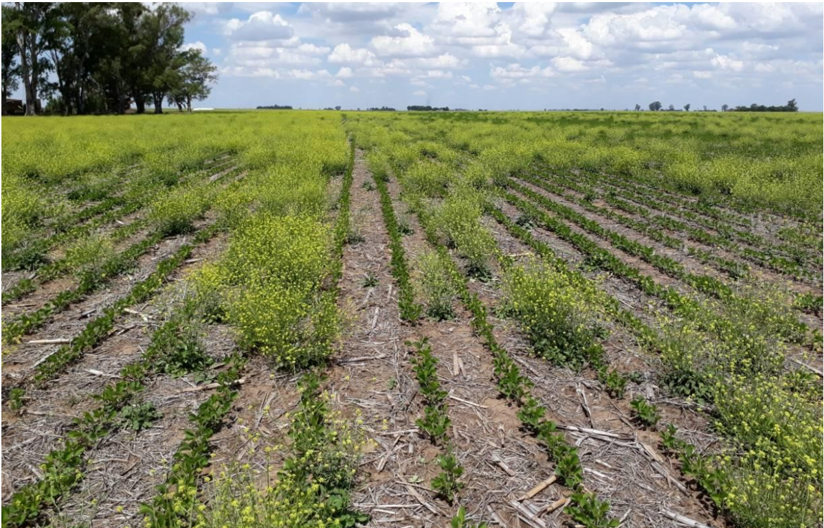
Figura 2: Lote de soja con infestación de H. incana resistente a glifosato y 2,4D, luego de fallas en el control de la maleza durante el barbecho.

En lotes cercanos a la localidad de Oncativo, destinados principalmente a la siembra de soja y maíz, se han observado desde el año 2016 fallas de control de esta especie a aplicaciones de glifosato + 2,4D realizadas durante el barbecho (Figura 2). Teniendo en cuenta esta situación, el equipo de Disherbología de la E.E.A de INTA Manfredi realizó ensayos a campo y en condiciones controladas para confirmar la resistencia y evaluar alternativas de control químico de este biotipo, denominado "Oncativo" (Ustarroz, 2017, 2018). Luego de las evaluaciones, se confirmó su resistencia a glifosato y 2,4 D. Sin embargo, ésta no fue elevada, requiriéndose para un 50% de reducción de biomasa 2,5 veces más dosis de ambos herbicidas que en un biotipo susceptible proveniente de Bordenave (Figuras 3 y 4).