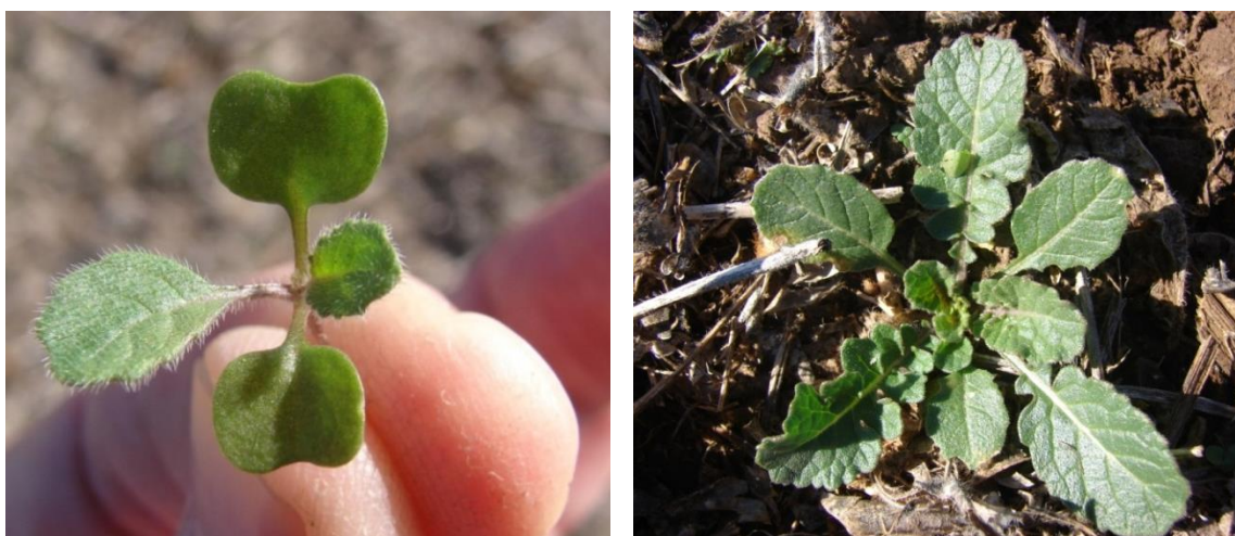
Figura 1: Plántula (izquierda) y roseta (derecha) de Hirschfeldia incana . Se pueden observar los cotiledones glabros y las primeras hojas con abundante pilosidad.

Hirschfeldia incana es una especie de la familia de las crucíferas, de ciclo anual o bienal. Nace principalmente en otoño - invierno, comportándose como maleza en cultivos invernales y aún de verano por su largo ciclo. Al inicio forma una roseta, densamente pubescente y áspera al tacto (Figura 1). Para una descripción más detallada de la especie ver Ustarroz (2017).