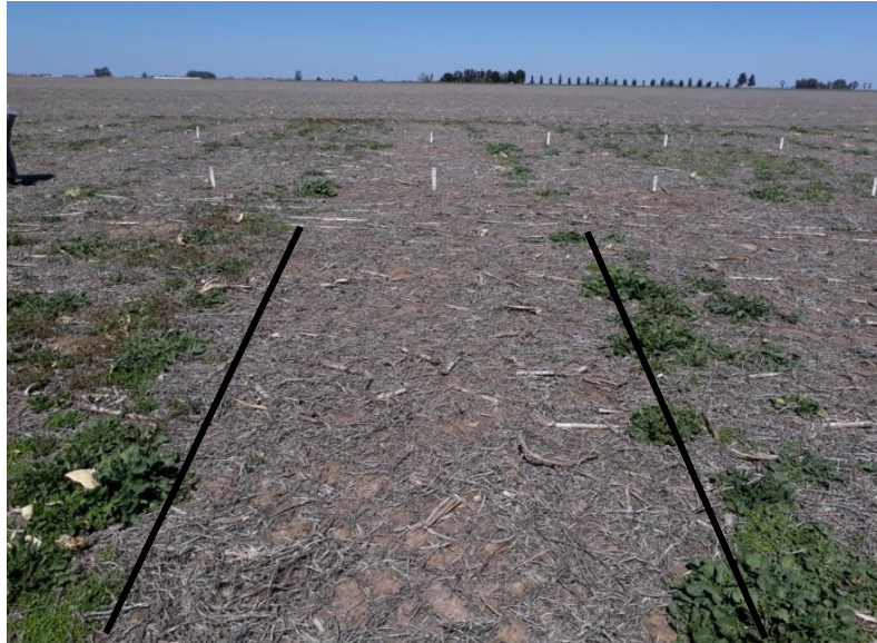
Figura 5: Parcela tratada con metsulfuron-metil a una dosis de 7 g. de producto formulado \text{ha}^{-1} (foto 100 días después de la aplicación).

En otro ensayo realizado durante 2017 pero en macetas, el biotipo Oncativo también presentó baja susceptibilidad a 2,4D (Tabla 2). Con glifosato se lograron mayores niveles de control que en la experiencia a campo (Tabla 1 y 2), pero se observó una gran variabilidad en la susceptibilidad de las plantas, sobreviviendo algunas a una doble dosis del herbicida (Figura 6). Con el resto de los tratamientos evaluados se obtuvo buen control.