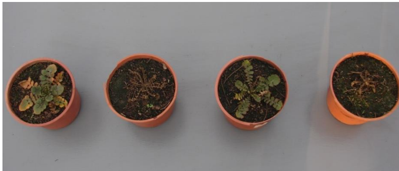
Figura 6: Plantas de H. incana (biotipo Oncativo) a los 30 días de la aplicación de glifosato a razón de 4 L. \text{ha}^{-1} de producto formulado (480 g. de equivalente ácido. \text{L}^{-1} )

En otro ensayo realizado durante 2017 pero en macetas, el biotipo Oncativo también presentó baja susceptibilidad a 2,4D (Tabla 2). Con glifosato se lograron mayores niveles de control que en la experiencia a campo (Tabla 1 y 2), pero se observó una gran variabilidad en la susceptibilidad de las plantas, sobreviviendo algunas a una doble dosis del herbicida (Figura 6). Con el resto de los tratamientos evaluados se obtuvo buen control.