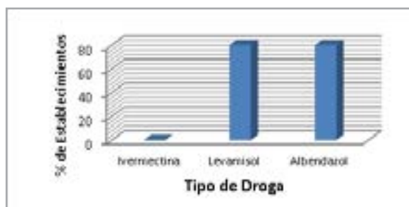
Figura 2: Susceptibilidad parasitaria en establecimientos según droga utilizada

En 4 establecimientos, existe también, resistencia, a las otras 2 drogas utilizadas: Fosfato de Levamisol 22,5 % y Albendazole al 10%, y Ricobendanzol. Coincidiendo con el único tambo que hemos analizado en la localidad de Calchaquí, y 3 establecimiento de cría, uno en la cuña boscosa y dos en la zona noroeste de la provincia de Santa Fe (figura 2).