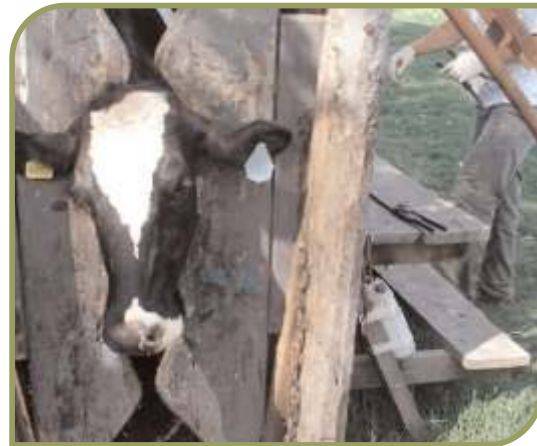
Figura 6. Aplicación de caravanas insecticidas (fosforados)