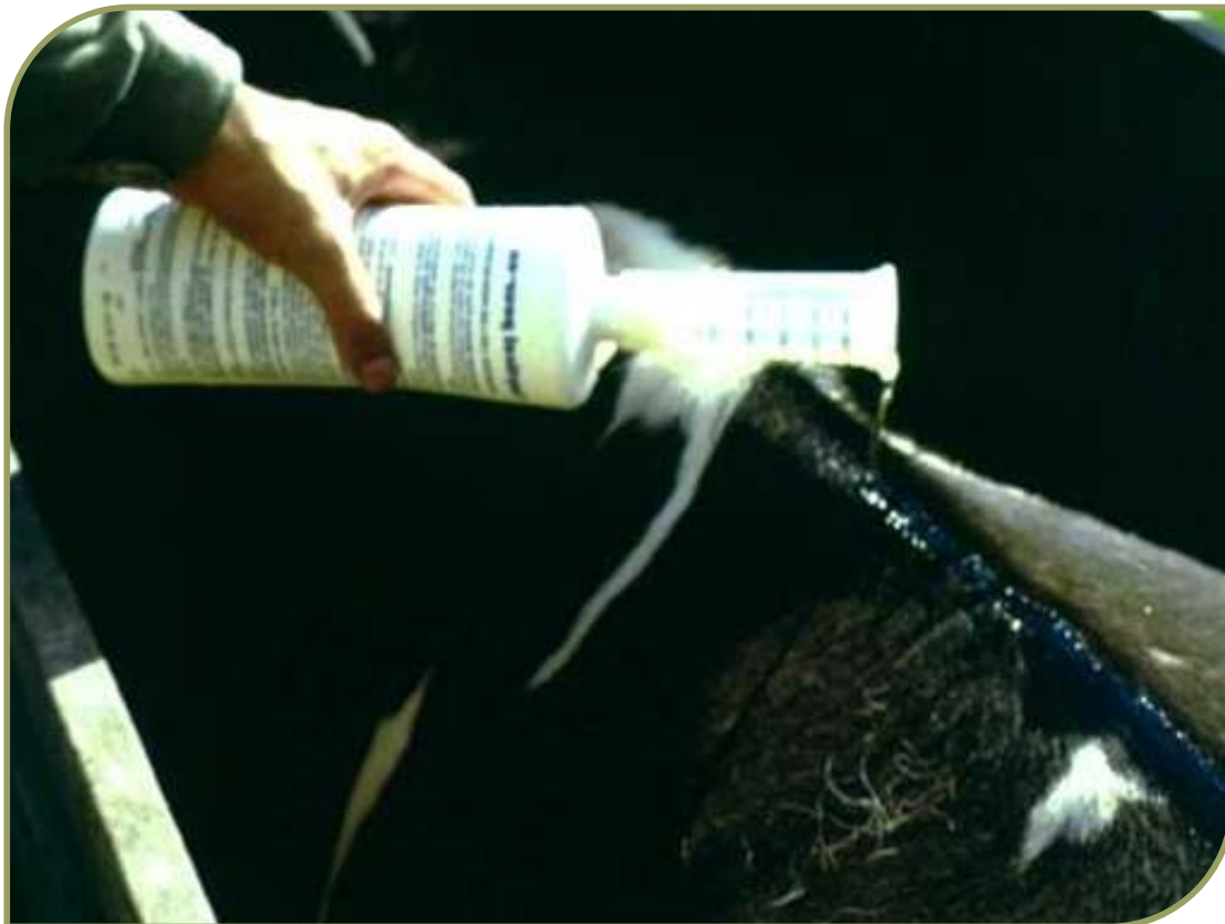
Figura 7. Aplicación pouron de insecticidas (piretroides, fosforados o imidacloprid)