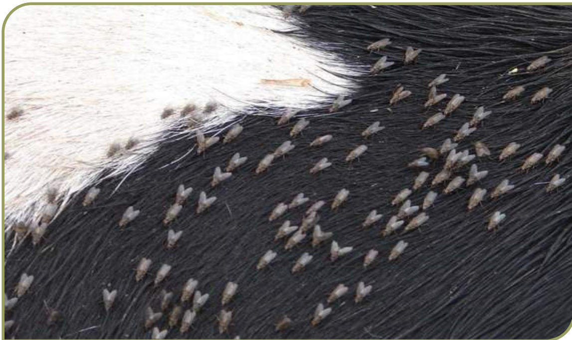
Figura 1 Adultos de Haematobia irritans sobre un bovino Holando

Las moscas adultas de H. irritans permanecen constantemente sobre los bovinos. Sólo los abandonan para colocar los huevos en la materia fecal fresca.