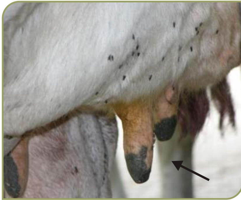
Figura 3. Haematobia irritans sobre glándula mamaria y pezones