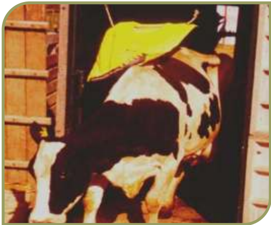
Figura 5. Bolsas auto-aplicadoras conteniendo insecticidas (fosforados o carbamatos)