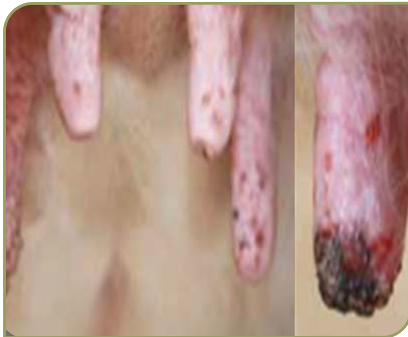
Figura 4. Pezones con lesiones producidas por Haematobia irritans.