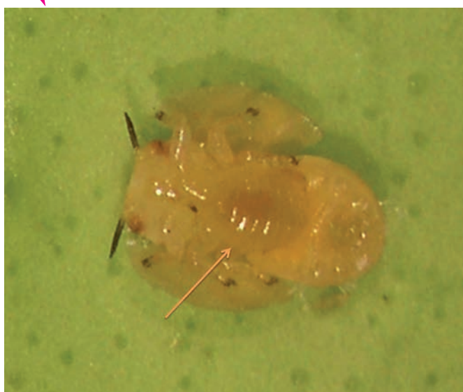
Foto 9. Larva de T. radiata