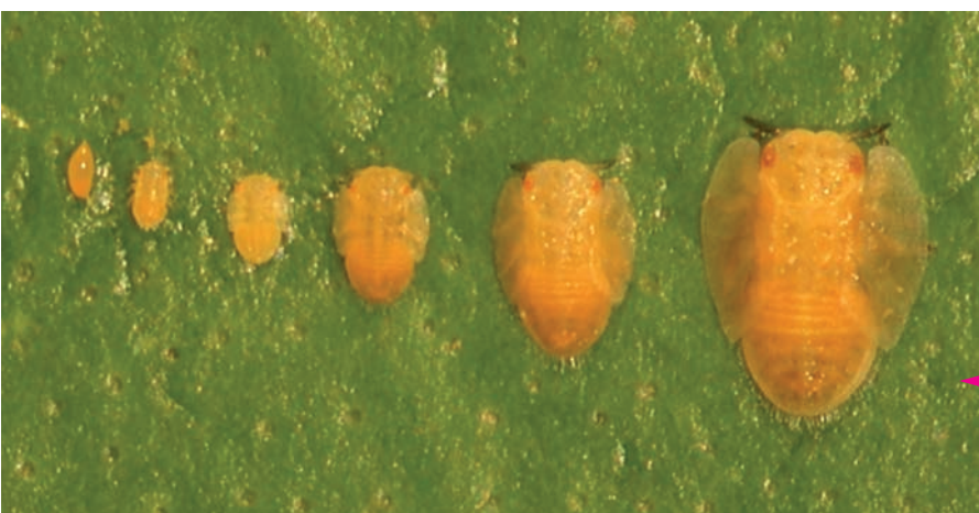
Foto 3. Huevo y estadios ninfales de D. citri