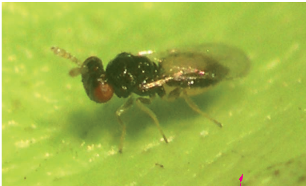
Foto 7. Adulto hembra de T. radiata