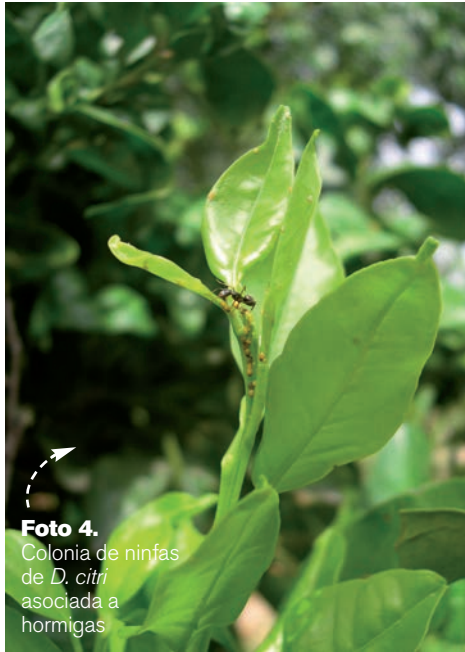
Foto 4. Colonia de ninfas de D. citri asociada a hormigas