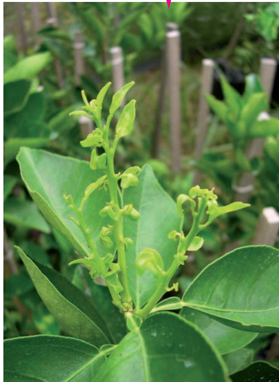
Foto 6. Daño directo producido por D. citri

embargo, el número de tratamientos fitosanitarios requeridos para un manejo suficiente del vector es muy elevado. De hecho, es común encontrar programas en los que se realizan más de 20 aplicaciones de insecticidas de síntesis al año en árboles adultos y más de cincuenta en plantaciones jóvenes. La sostenibilidad de programas de gestión tan agresivos queda más que en entredicho. Por otro lado, en regiones donde la proporción de árboles infectados ya es elevada, como es el caso de Florida, la destrucción de éstos se torna inviable desde el punto de vista económico. En dichas circunstancias, la única solución es intentar convivir con la enfermedad.