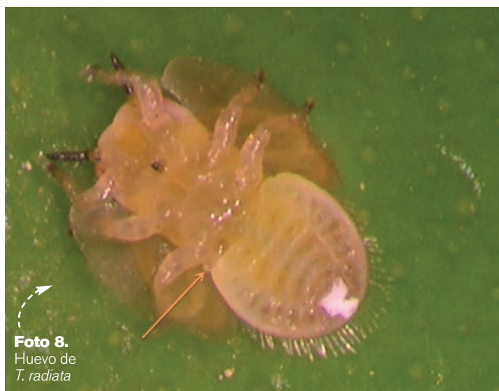
Foto 8. Huevo de T. radiata

Fotografías tomadas en EEA Concordia - INTA, Entre Ríos, Argentina por Juan Pedro R. Bouvet.