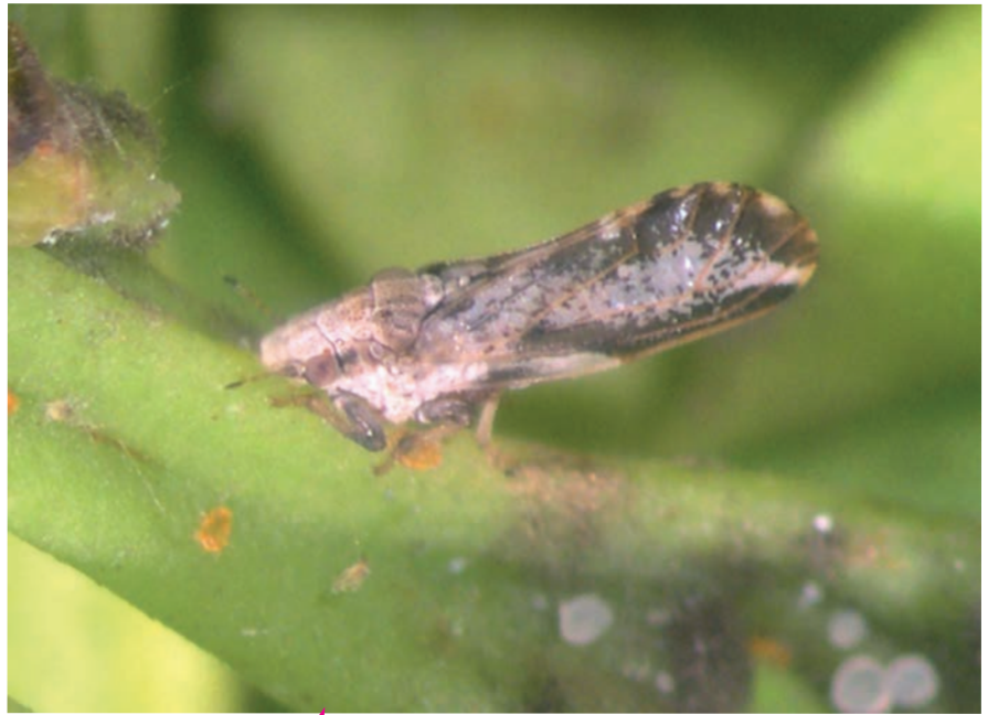
Foto 5. Adulto de D. citri

bre la superficie del tejido vegetal y sirve de sustrato para el desarrollo de fumagina o negrilla. La importancia de D. citri sin embargo radica en su papel como vector del HLB. Cuando el psílido se alimenta de plantas hospederas infectadas adquiere la bacteria. Tanto las ninfas de cuarto y quinto estadio como los adultos pueden transmitir la enfermedad. Sin embargo, el adulto es el único estado de desarrollo con capacidad de desplazamiento entre árboles y por lo tanto, el único vector verdadero.