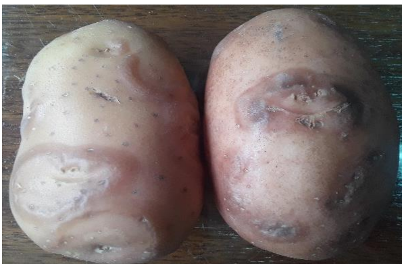
Figura 10: Variedad Yona afectada por virosis.

Los datos pertenecientes al porcentaje de sanidad indican que las variedades con un mejor desempeño sanitario fueron el Clon B10.551.3, 7 four 7 y Frital INTA; con un promedio del 95,8%. En cuanto a Rivola, la sanidad decayó un 22% por la sensibilidad a Fusarium Solani , y la variedad Yona tuvo un mal desempeño debido a una virosis (figura 10) llegando a tener un 63% de sanidad (tabla 2).