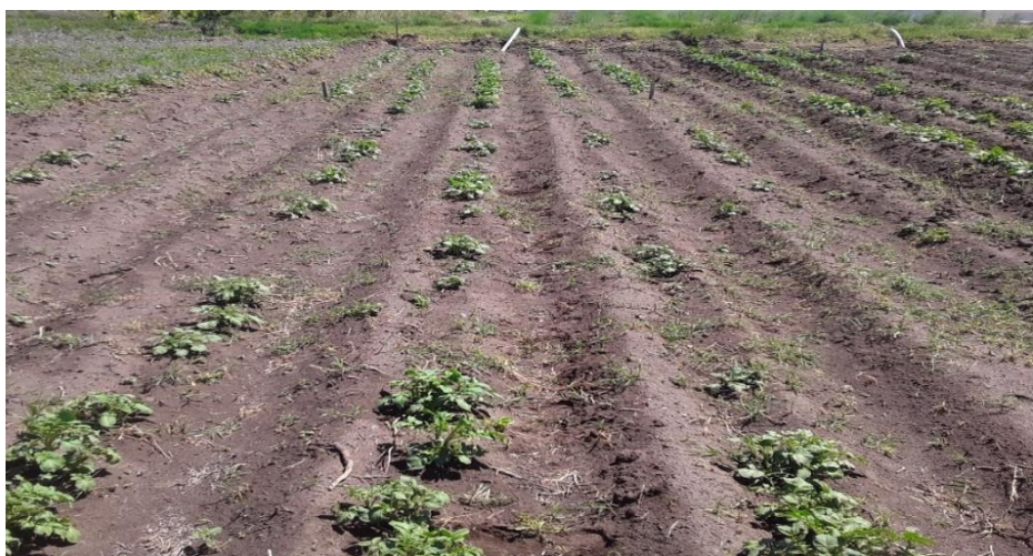
Figura 5: cultivo de papa en fase de emergencia, donde se observa la falta de plántulas de la variedad 7 Four 7 en el centro (Foto Paolo Sánchez, noviembre 2022. INTA H. Ascasubi).

Con respecto a las parcelas de evaluación, cada tratamiento se distribuyó en 5 surcos de 10 m por cada variedad con 3 repeticiones y la superficie total del ensayo fue de 600m 2 (20m x 30m). La fecha de emergencia fue a partir de principios de noviembre, y se observó la cantidad de plantas emergidas. La variedad 7 Four 7 tuvo fallas de emergencia en un 35% aproximadamente, mientras que el resto de las variedades no tuvo inconvenientes (figura 5).