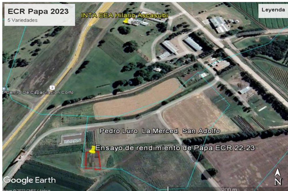
Figura 1: imagen Google Earth del ensayo.

Las labores de suelo consistieron en dos pasadas de rastra de discos pesados, dos pasadas de cincel y el preparado de la cama de siembra se realizó con rastra y rolo desterronador. Se realizó un riego pre-siembra para asegurar la emergencia y establecimiento de las plantas debido a que, en etapas iniciales (emergencia y crecimiento temprano GS1 y GS2), los cultivos son sensibles al estrés hídrico. Luego se regó hasta GS5, teniendo en cuenta las etapas más críticas del cultivo; inicio de tuberización GS3 (se determina el potencial de rendimiento) y aumento de tamaño de tubérculos GS4 (sin agua, se deforman los tubérculos y se hacen susceptibles a enfermedades).