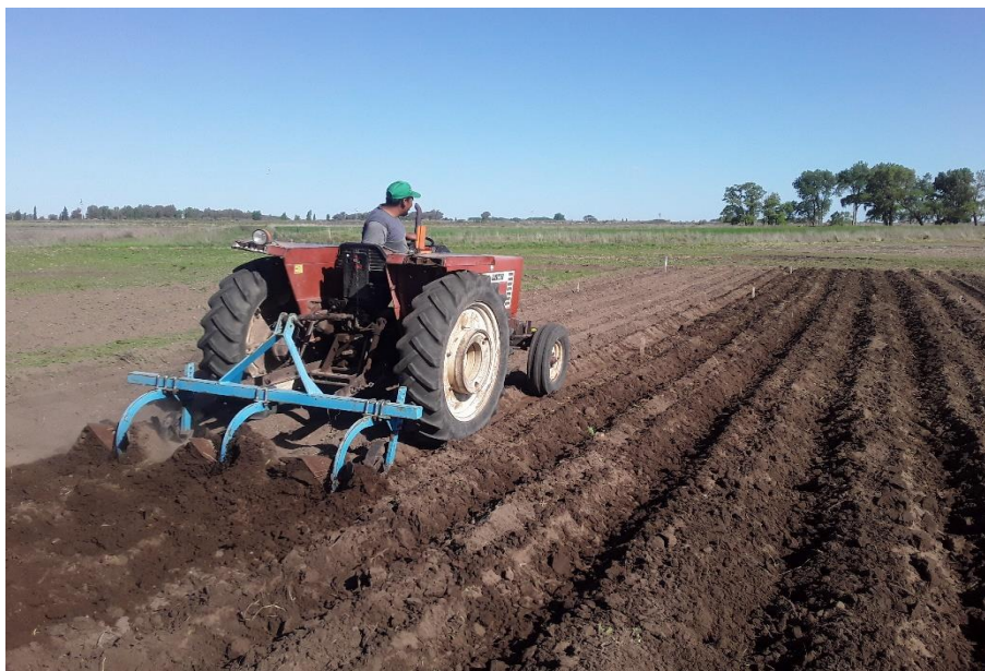
Figura 3: realización del marco de plantación con aporcador de 3 puntos.

La fecha de plantación fue el 14 de octubre de 2022. Se utilizó un aporcador para la apertura, tapado y formación de los surcos (figura 3).