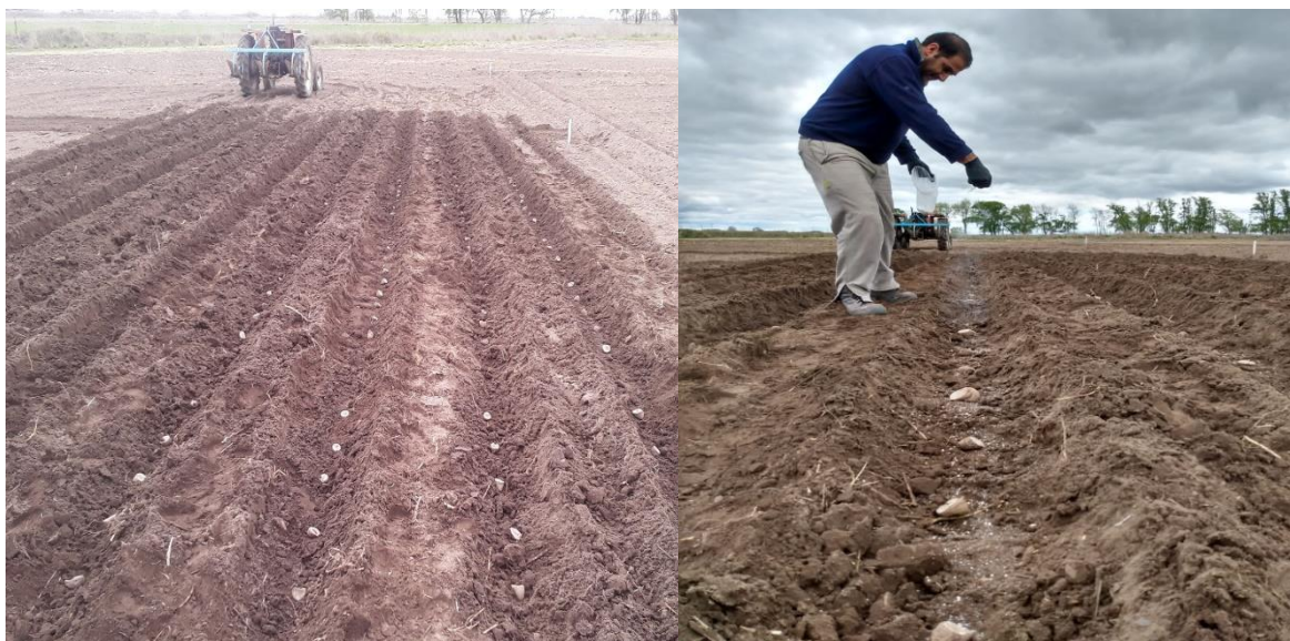
Figura 4: Distribución el fertilizante fosfatado y el hidrogel en el surco de plantación junto con la semilla de papa variedad Frital INTA y la variedad Rivola.

Con respecto a las parcelas de evaluación, cada tratamiento se distribuyó en 5 surcos de 10 m por cada variedad con 3 repeticiones y la superficie total del ensayo fue de 600m 2 (20m x 30m). La fecha de emergencia fue a partir de principios de noviembre, y se observó la cantidad de plantas emergidas. La variedad 7 Four 7 tuvo fallas de emergencia en un 35% aproximadamente, mientras que el resto de las variedades no tuvo inconvenientes (figura 5).