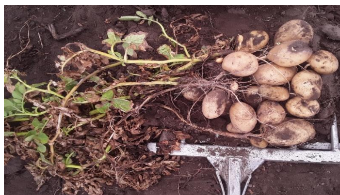
Figura 8: Obtención de muestras para rendimiento de plantas de la variedad 7 four 7, (3 plantas contiguas en un metro de surco y posterior análisis de los parámetros por cada planta en GS5).

La cosecha y muestreo de tubérculos se realizó con una laya de 5 puntas teniendo en cuenta 3 plantas/metro lineal de surco, y en total se tomaron 9 muestras por parcela. Los parámetros de medición fueron: peso de tubérculos comercializables, para semilla y descarte; número de tubérculos (comercializables y para semilla) y su forma-aspecto comercial (figura 8).