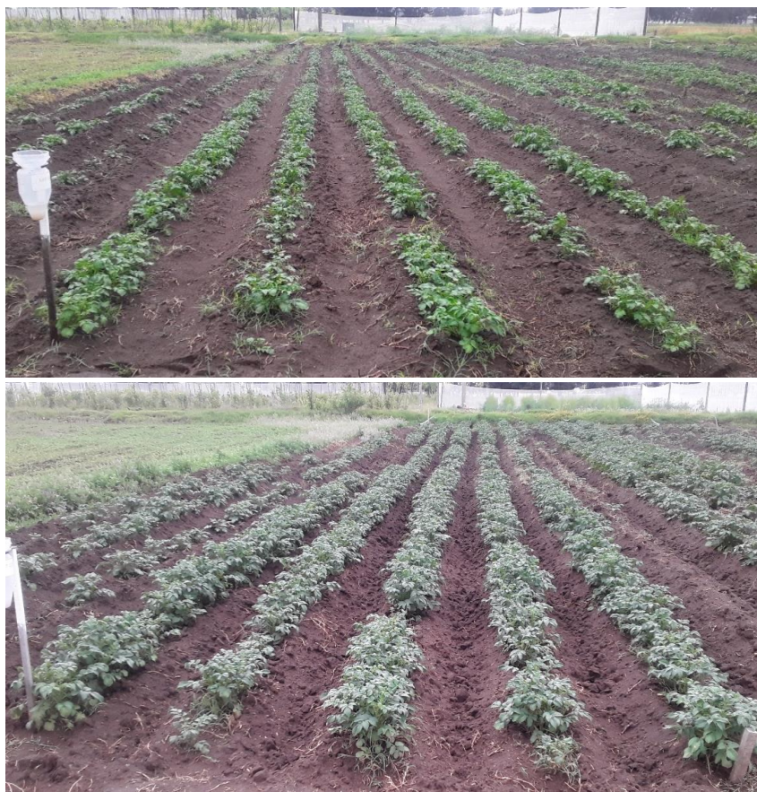
Figura 6: Aporcado e incorporación de urea en 2 oportunidades antes de los 50 días de emergencia en GS3 (Fotos obtenidas el 18-11-2022 y el 28-11-2022).

Respecto a las labores culturales y fertilización se realizaron dos aporques antes de los 50 días desde la emergencia, donde se incorporó 300kg/ha. de urea dividido en dos dosis, es decir, 150kg/ha. por cada aporque (figura 6). Se asperjó 5lt/ha. de fosfito de potasio aplicado en 3 ocasiones a razón de 1.67lts/ha. y 2lt de derivados de nitrógeno al 32% vía foliar dividiendo la dosis en 3 ocasiones.