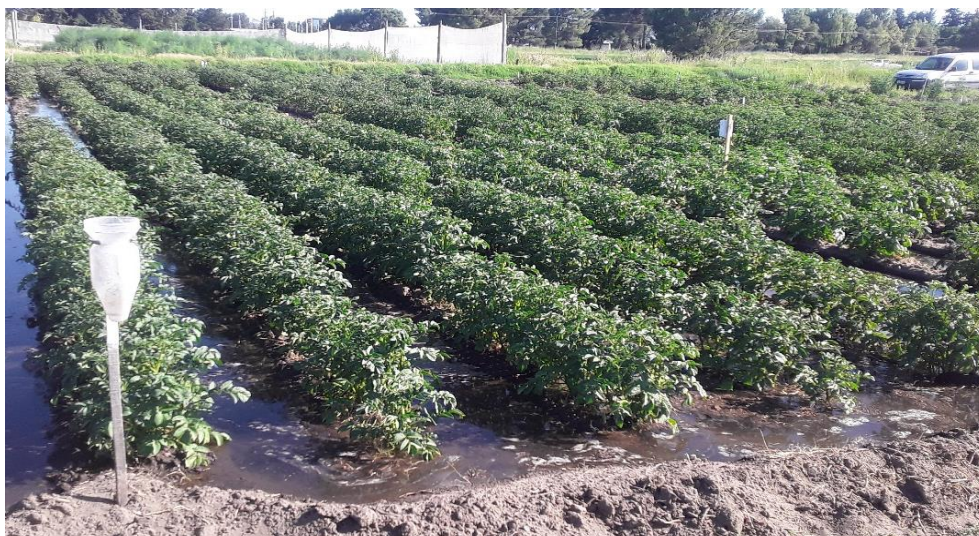
Figura 7: Riego por surcos con frecuencia de 6 días en GS4 (sector izquierdo del ensayo, variedad Rivola en cabecera de riego, 7 Four 7 en el centro y Yona al pie de riego).

En total se aplicó 10 riegos, de una duración promedio de 1 hora y media. La frecuencia de riego fue aproximadamente cada 6 días durante el turno correspondiente (figura 7).