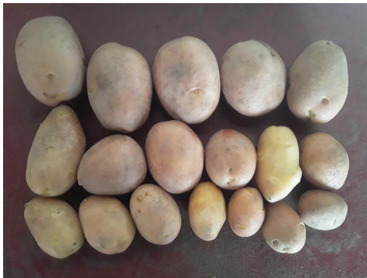
Figura 9: clasificación de tubérculos por categorías de la variedad Yona

Los criterios empleados fueron los siguientes: tubérculo comercial: > 90 gr; tubérculo semillón: < 90 gr; descarte: tubérculos < 35 gr y tubérculos deformes: muñecos y crecimientos secundarios excesivos (figura 9).