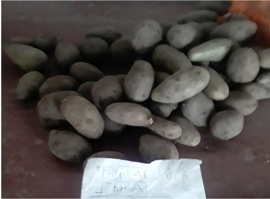
Figura 2: selección de semilla certificada por sanidad y tamaño, variedad Frital INTA.

La fecha de plantación fue el 14 de octubre de 2022. Se utilizó un aporcador para la apertura, tapado y formación de los surcos (figura 3).