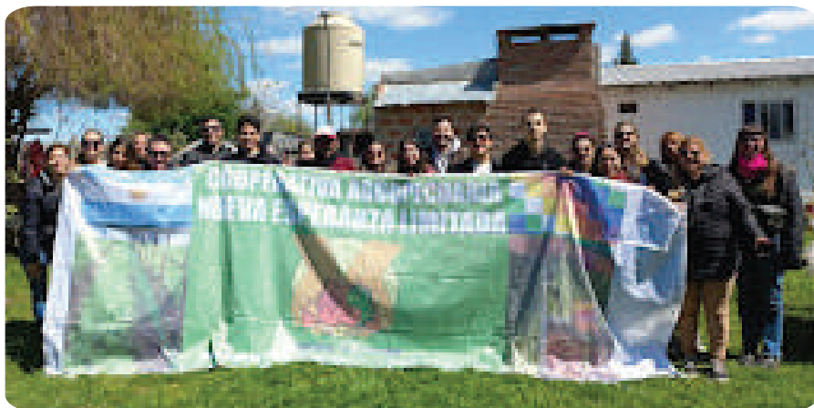
Visita a quintas de familias productoras con estudiantes de la Cátedra 3 de Derecho Agrario