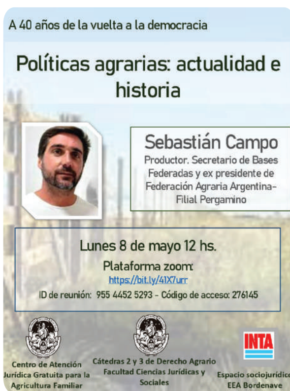
Charla "Políticas agrarias: actualidad e historia. A 40 años de la vuelta a la democracia"