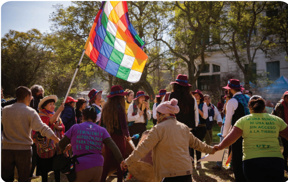
Participación en las 11mas Jornadas de la Agricultura Familiar de la UNLP