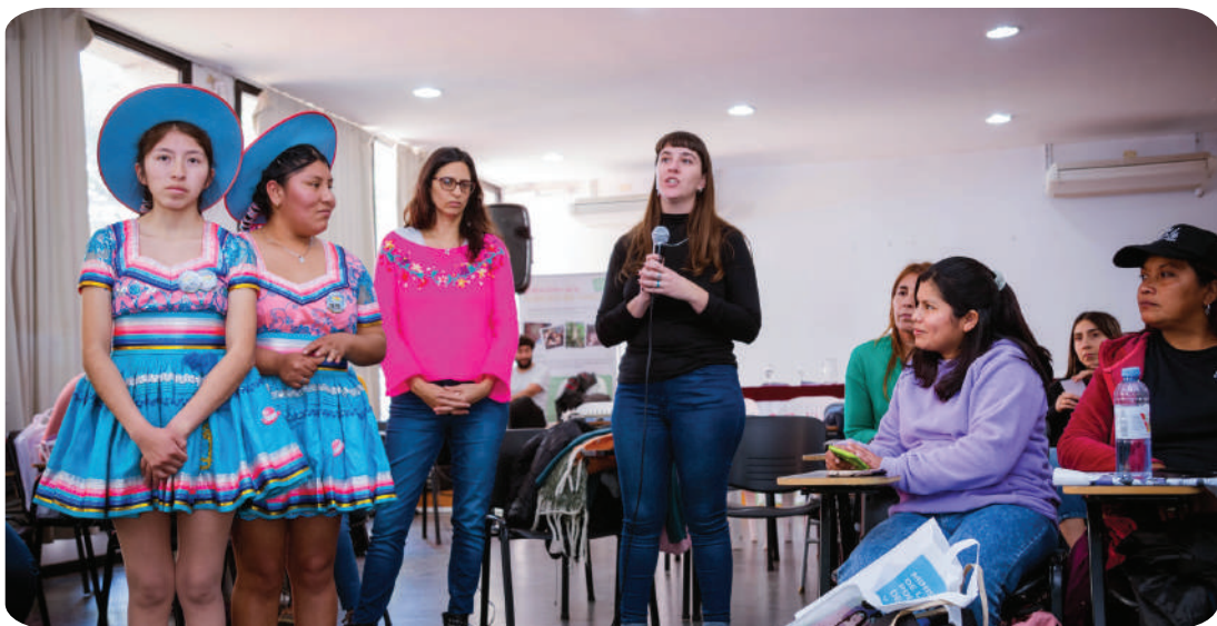
Participación en las 11mas Jornadas de la Agricultura Familiar de la UNLP