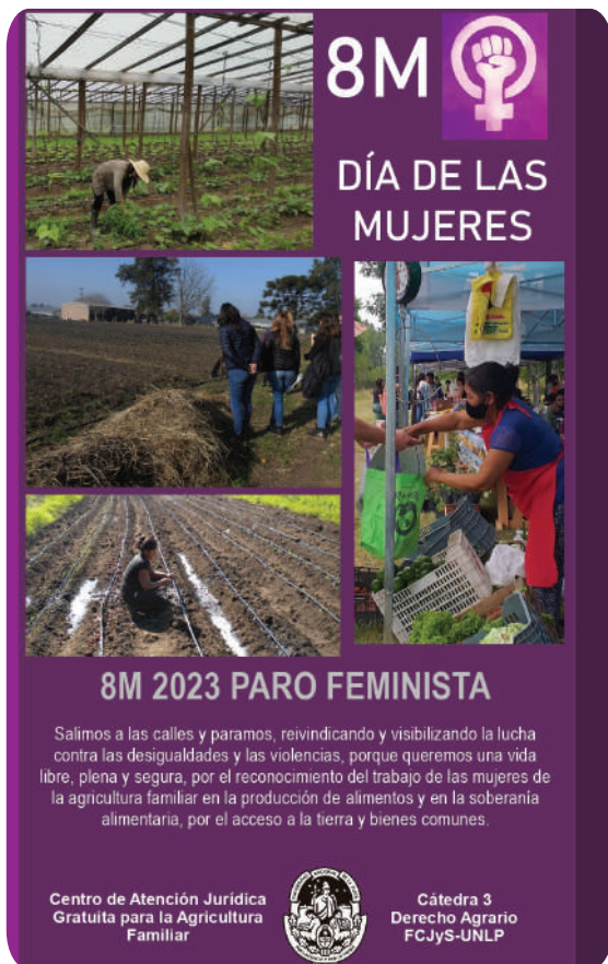
Difusión sobre el 8M