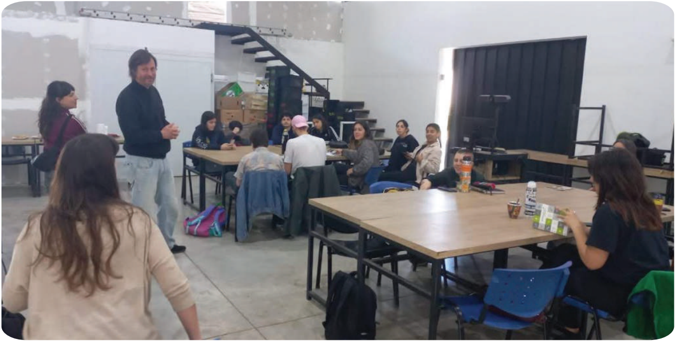
Clase género y ruralidad en el entrenamiento laboral de la comercializadora La Justa