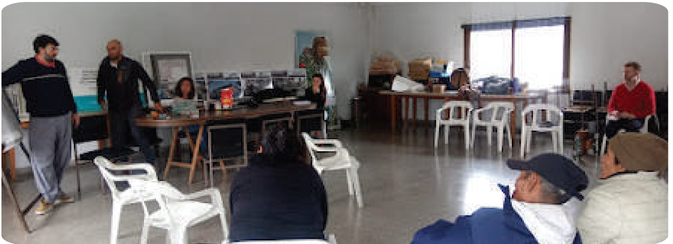
Jornada de asesoramiento jurídico gratuito para la agricultura familiar en Mar del Plata