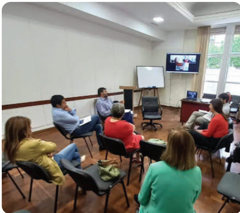
Mesa "Territorios socio-productivos, problemáticas ambientales y políticas agrarias en la producción de alimentos" en las IV Jornadas Nacionales del Instituto de Cultura Jurídica