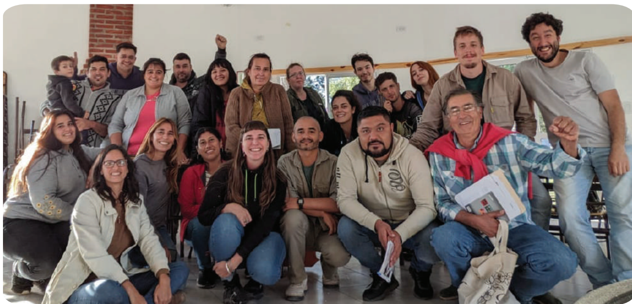
Clase sobre procesos asociativos y legislación agraria en la Diplomatura Universitaria en Ganadería Familiar Sustentable