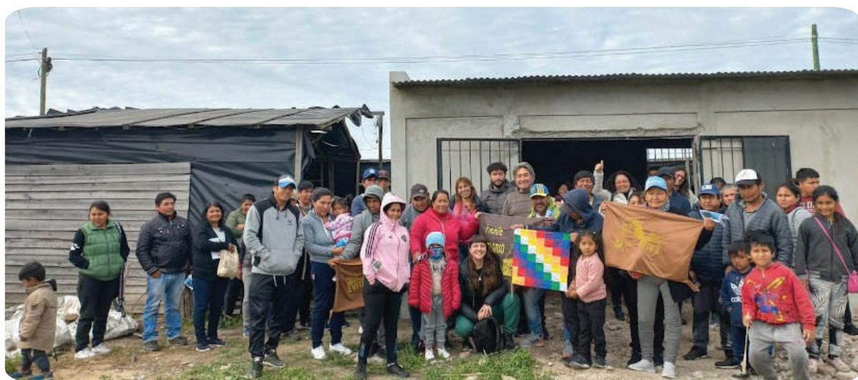
Jornada acercando derechos con Asociación Civil 15 de abril y la Cooperativa SembrArg