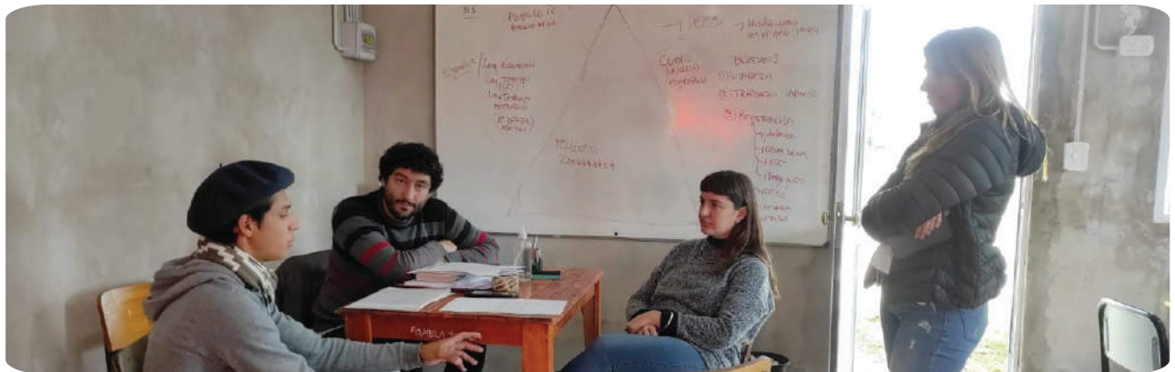
Taller en el CEPT 29 sobre cuestiones laborales en el ámbito agrario