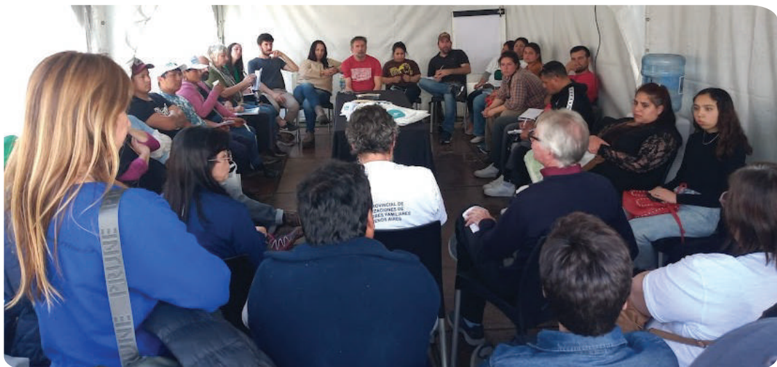
Taller sobre asociativismo en la 7ma Feria Provincial de Intercambio de Semillas Nativas y Criollas

Secretaría de Agricultura, Ganadería y Pesca | Ministerio de Economía Argentina | DERECHO AL FUTURO | MINISTERIO DE DESARROLLO AGROARIO | GOBIERNO DE BUENOS AIRES