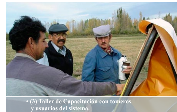
• (3) Taller de Capacitación con tomeros y usuarios del sistema.

También se da el acompañamiento en el proceso organizacional del sistema de riego: en un primer momento, mediante un sistema de delegados por tramos de canal, y posteriormente bajo la figura de Asociación Civil. Todas las tareas se realizan de manera articulada con las instituciones mencionadas en párrafos anteriores.