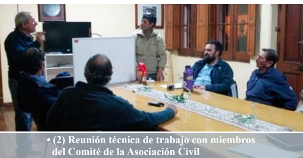
• (2) Reunión técnica de trabajo con miembros del Comité de la Asociación Civil

Mediante talleres y reuniones periódicas con los regantes se busca generar los consensos para la gestión participativa y formalizada del agua de riego. Se plantea dinamizar el proceso participativo, capacitar y asistir técnicamente con recursos humanos y logística desde su etapa inicial (consenso y formalización) como en su funcionamiento posterior. Estas actividades se realizan desde una red técnica interinstitucional: INTA, DPA Y SAF (Fotografía 2).