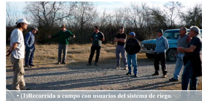
• (1) Recorrida a campo con usuarios del sistema de riego.

Desde 2013, los usuarios han ido encontrando y construyendo un modo alternativo de gestión del recurso, consolidándose bajo la figura de Asociación Civil de Regantes Lote G 80-Paraje El 15. De este modo surgió una manera alternativa de organización del sistema de riego, que podría ser contemplada dentro del código de aguas bajo la figura de comunidad de usuarios.