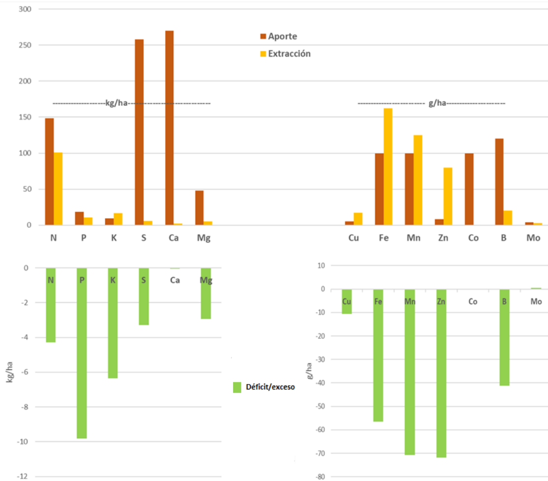
Figura 2: Balance gráfico entre el aporte de elementos minerales por el riego y los fertilizantes (Aporte), la extracción efectiva realizada por el cultivo de trigo (Extracción) y el déficit o exceso absoluto para el rendimiento obtenido respecto a los valores de referencia (Déficit/exceso).