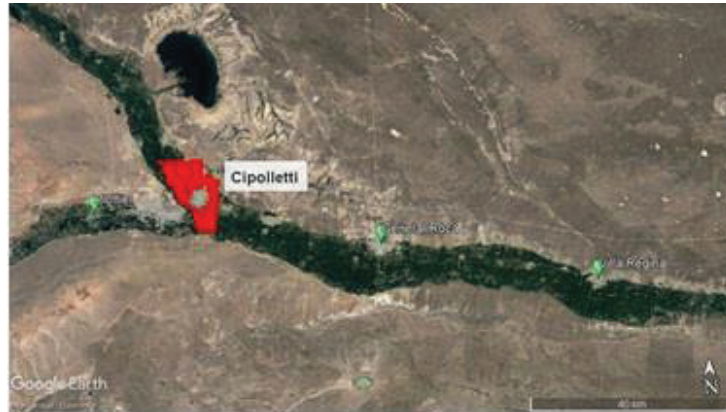
Figura 2: Ubicación geográfica del Consorcio de regantes de Cipolletti

La Red de Riego atendida por este Consorcio está compuesta por 79.269 metros de canales de riego y 72.520 metros de canales de drenaje, administra una superficie bajo riego de 6.700 hectáreas y consta de 1.443 usuarios. La tarea asignada consiste en dos actividades principales, la operación y el mantenimiento.