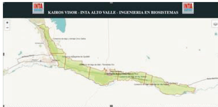
Figura 16: AVRNYN. Fuente: Visor Web. Ingeniería en Biosistemas INTA EEA Alto Valle, 2017

Chichinales. La cabecera es el dique nivelador Ing. Ballester, en la margen izquierda se encuentra la toma del Canal Principal de 130 kilómetros del cual nacen los Canales Secundarios que dan origen a los siete consorcios de riego (Figura 1): Cinco Saltos – Cipolletti – Allen/Fernandez Oro – General Roca – Cervantes – Ingeniero Huergo –General Godoy/Villa Regina/Chichinales.