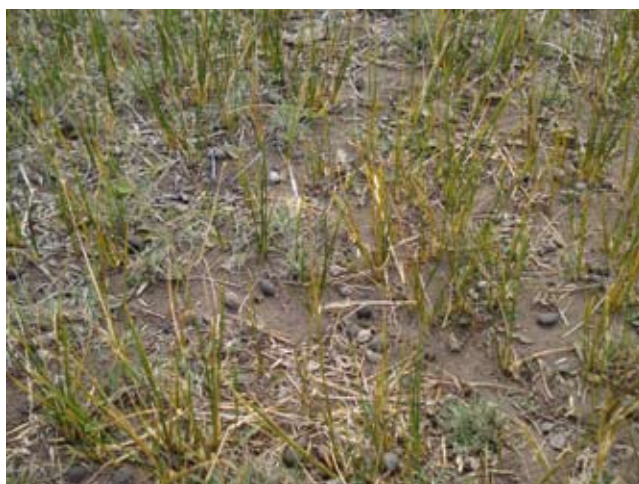
Foto 16: Mallin seco severamente deteriorado. Valle del Río Coyle