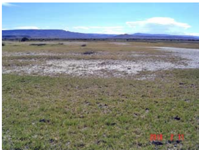
Foto 4. Sales en superficie. Valle del Río Chico