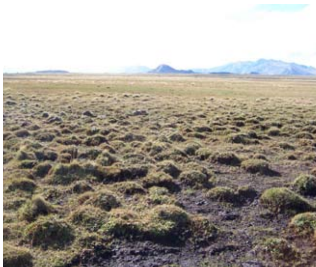
Foto 3. Mogotes con suelo desnudo. Estancia Lago Belgrano