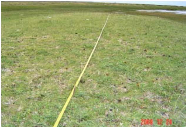
Foto 8: Mallin húmedo moderadamente deteriorado. Valle del Río Coyle