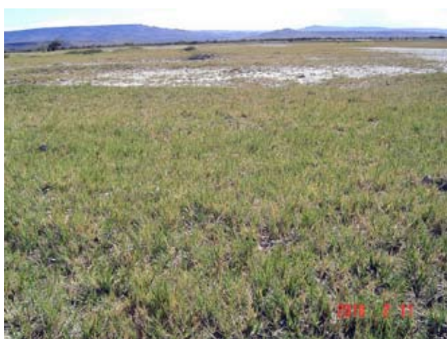
Foto 18: Mallin seco severamente deteriorado. Valle del Río Chico. Nótese el predominio de la especie indicadora Distichlis spicata .