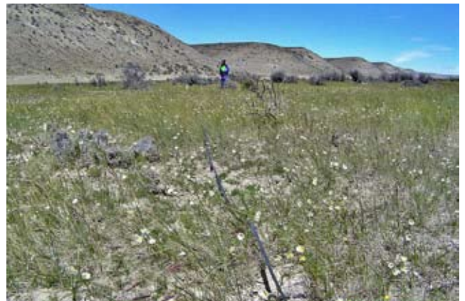
Foto 11: Mallin húmedo severamente deteriorado. Valle del Río Chico