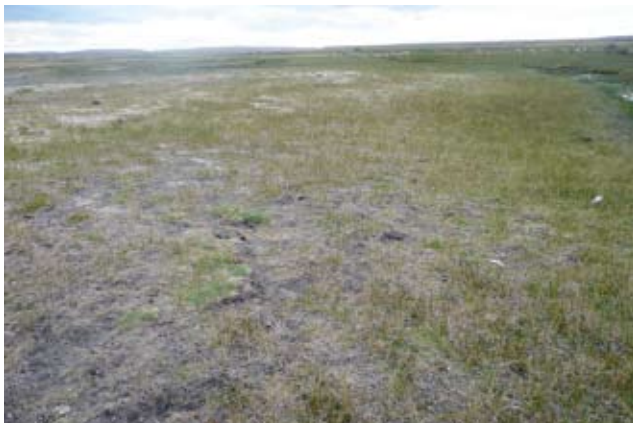
Foto 10: Mallin húmedo severamente deteriorado. Valle del Río Coyle. Nótese el alto porcentaje de suelo desnudo.