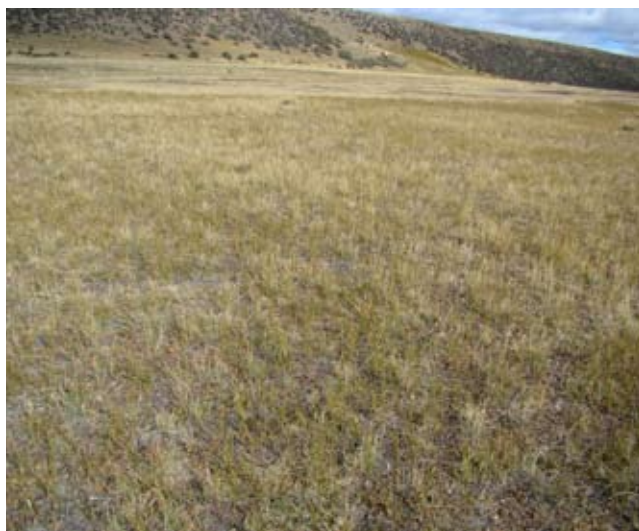
Foto 14: Mallin seco moderadamente deteriorado. Valle del Río Gallegos