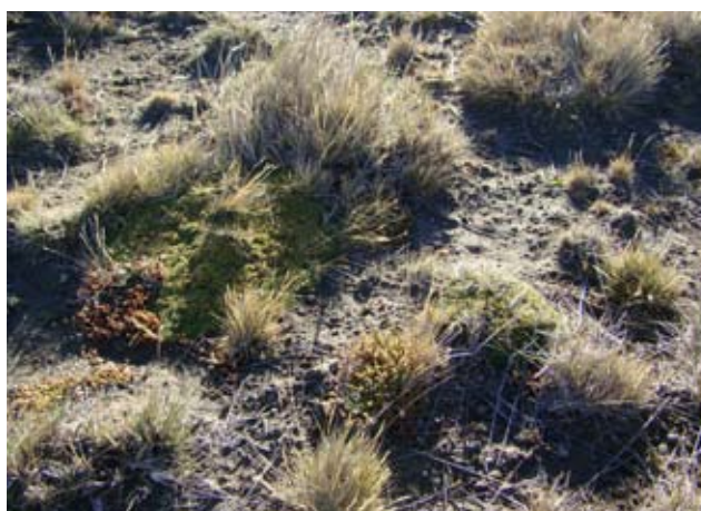
Foto 17: Mallin seco severamente deteriorado. Valle del Río Gallegos