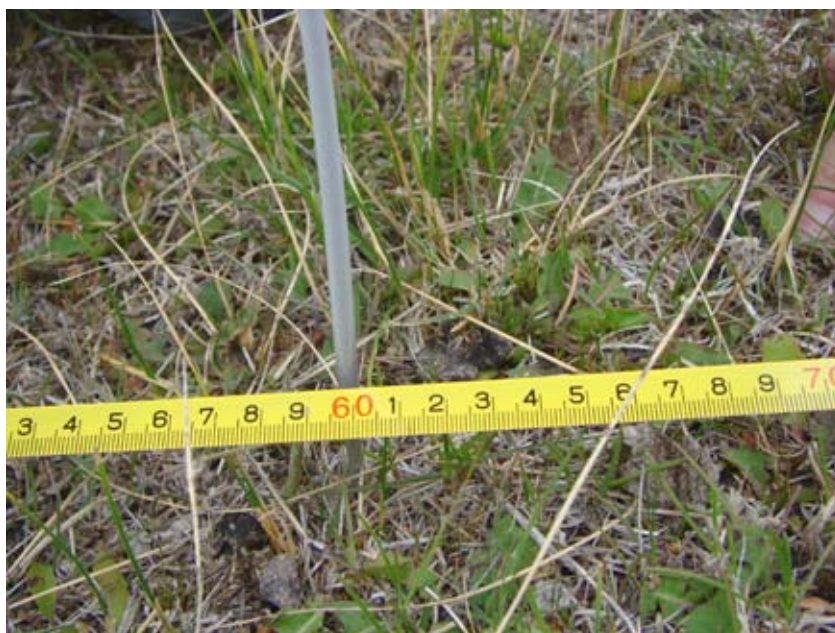
Foto 5. Detalle de medición con toques.

prioriza en primer lugar la presencia de especies forrajeras o indicadoras; en segundo lugar se prioriza la presencia de material muerto en pie. Luego, si no se encuentra material muerto en pie, se registra la presencia de mantillo o suelo desnudo. Por lo tanto, el material muerto en pie, mantillo y el suelo desnudo se tendrán en cuenta solo cuando no se encuentre una especie vegetal en el toque.