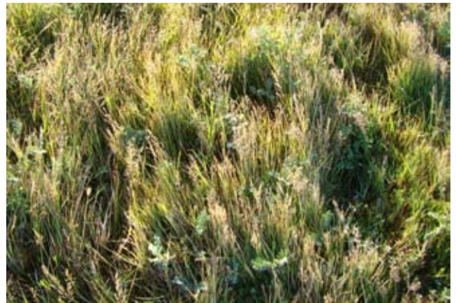
Foto 9: Mallin húmedo moderadamente deteriorado. Valle del Río Gallegos. Nótese el alto porcentaje de Acaena magellanica.