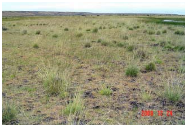
Foto 15: Mallin seco moderadamente deteriorado. Valle del Río Coyle