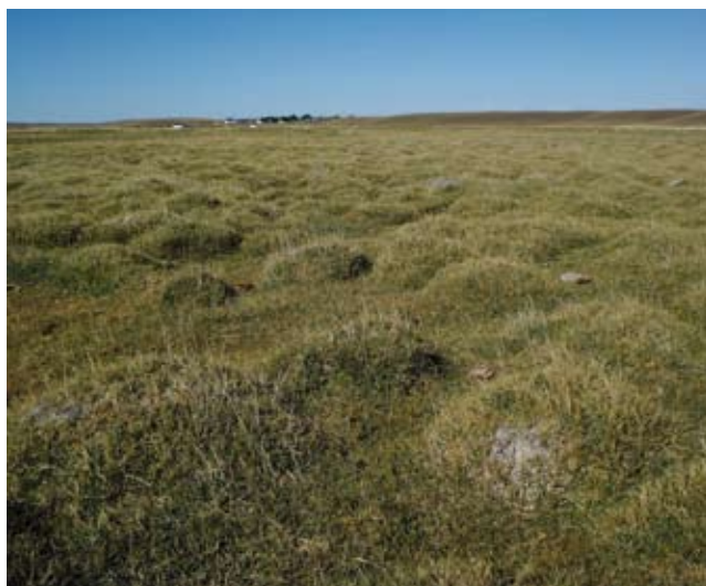
Foto 2. Mogotes. Valle del Río Coyle