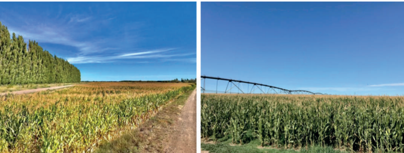
Fig. 2. Lotes de maíz en la región, con riego.

Se recolectaron muestras de 6 lotes bajo riego (Fig. 2) bastante enmalezados, distanciados entre sí como máximo 40 km, de las localidades de Pomona, Establecimiento Agrónica, Pichi Lauquen, Choele Choel y Luis Beltrán. En cada lote se efectuaron dos tipos de muestreo: 1) Muestreo al azar: se realizaron sobre una diagonal del lote, colectando 1 hoja por planta, de 30 plantas distanciadas al menos 10 pasos 2) Muestreo de plantas con síntomas: se recolectaron muestras de hojas de plantas que presentaban síntomas compatibles con virus o espiroplasma. Las muestras se colocaron en bolsas plásticas rotuladas y se mantuvieron en conservadora a 4°C hasta su llegada al laboratorio donde fueron inmediatamente fotografiadas y acondicionadas hasta su procesamiento.