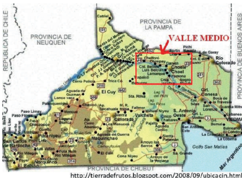
Fig. 1. Región de muestreo de lotes de maíz en el Valle Medio del río Negro, Río Negro, Argentina.

El estudio se llevó a cabo durante la campaña 2021/22, en la región del Valle Medio del río Negro (Fig. 1) la cual se caracteriza por ser una zona seca con agricultura bajo riego por inundación, por surco o por aspersión. La superficie promedio sembrada con maíz en esta campaña fue 6.500 ha aproximadamente, el destino principal del maíz es como grano y en menor medida como picado de planta entera para alimentación de ganado.