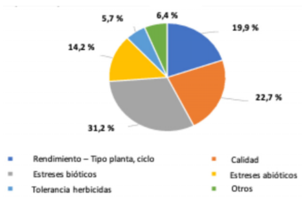
Figura 2. Porcentaje de citas según carácter modificado mediante CRISPR-Cas9.