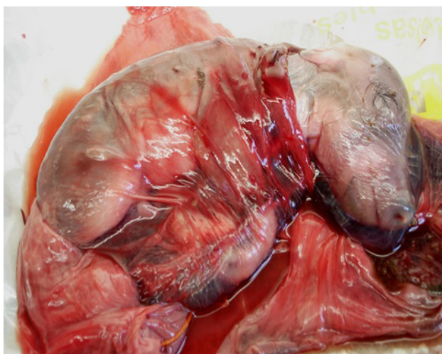
Figura 3. Feto jabalí abortado.