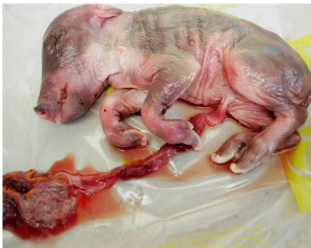
Figura 2. Feto jabalí abortado.