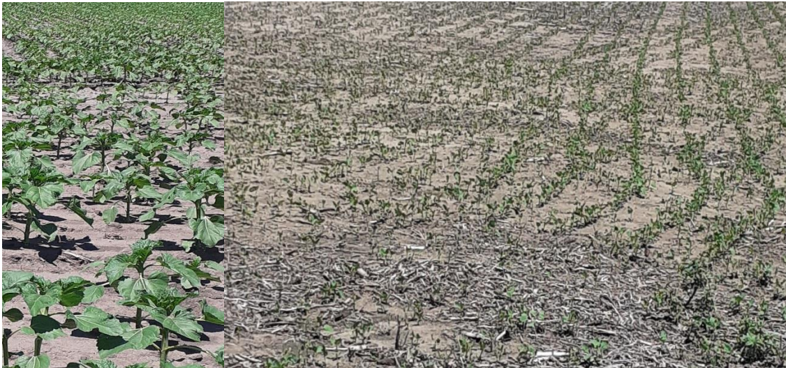
Girasol, dpto Realicó y soja en emergencia, dpto. Trenel 1/12/21

Soja: Siembras de primera sólo en departamentos ubicados al norte del área monitoreada. Estas sojas en estado fenológico (V2 a V4). Tendencia a retraso de las siembras en toda el área relevada. Barbechos preparados para continuar con implantaciones durante diciembre. Predominan lotes sembrados a partir de la segunda quincena de noviembre, (estado actual en emergencia o en estado de cotiledón), y menor proporción de siembras tempranas en noviembre.