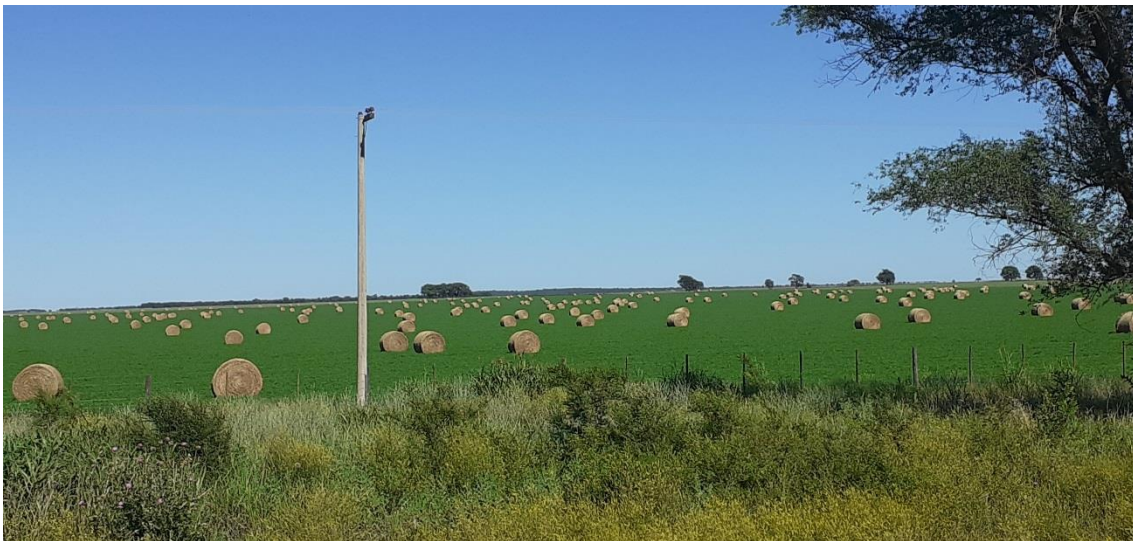
Pastura alfalfa. Depto Conhello, 1/12/21

Región SE: de Primavera-Verano (Llorón –Mijo Perenne) y otoño –Invierno (Agropiro- Festuca – alfalfa). Durante el invierno a lotes de mijo perenne y pasto llorón se le realizaron labores de renovación con remoción mecánica y control de paja con herbicidas. Se ha realizado importante cantidad de reservas con avena y alfalfa (rollos) y silaje de avena y cebada. Continúa la siembra de sorgo forrajero y maíz la mayoría con controles de plagas. Los pastizales naturales han sido afectados por condiciones meteorológicas (escasez de precipitaciones) y de manejo (sobrepastoreo) en departamentos Hucal y Caleu Caleu. Aunque existen buenas chances de recuperación por las abundantes lluvias entre la segunda quincena de noviembre e inicios de diciembre.